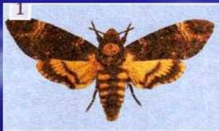
Бражник мертва голова