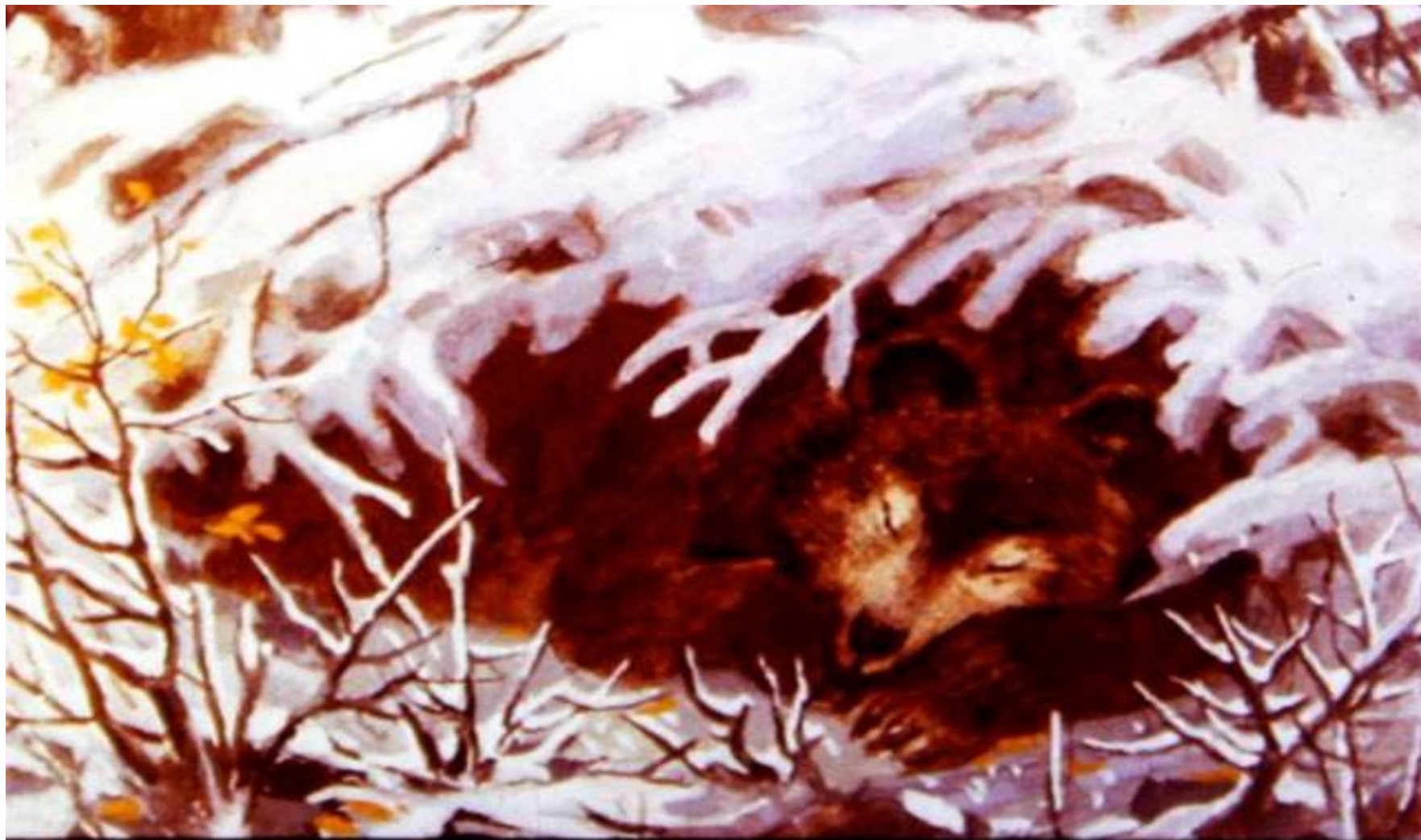
Медведь в берлоге лапу сосет.