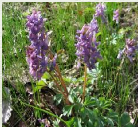
Ветреница дубравная персиколистный