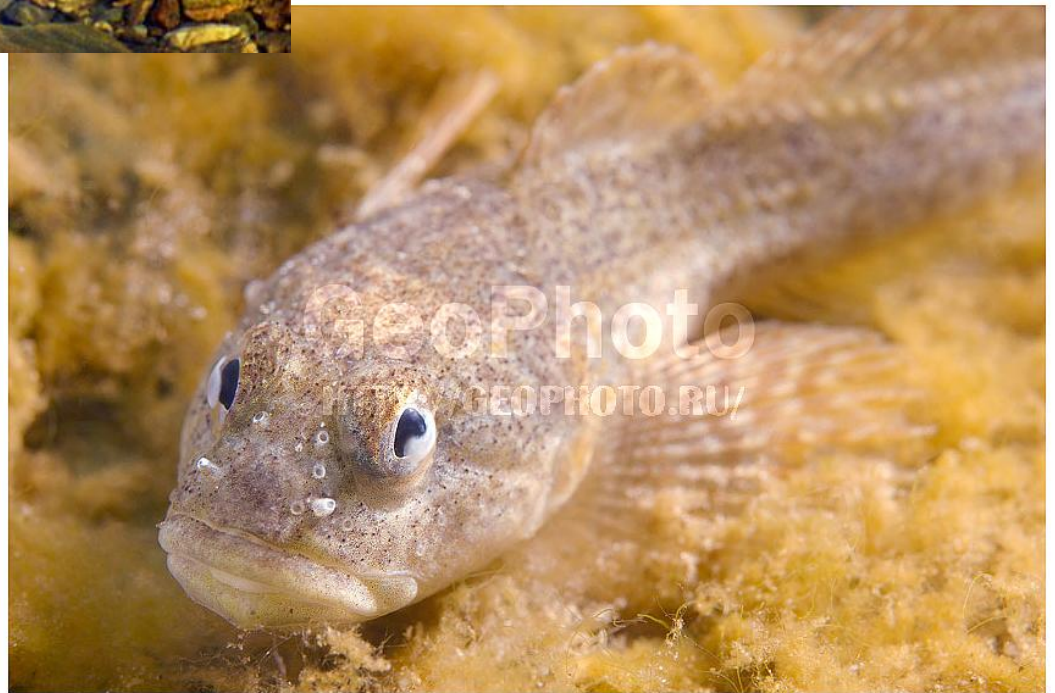
# nek212079883 Baikal, underwater collection