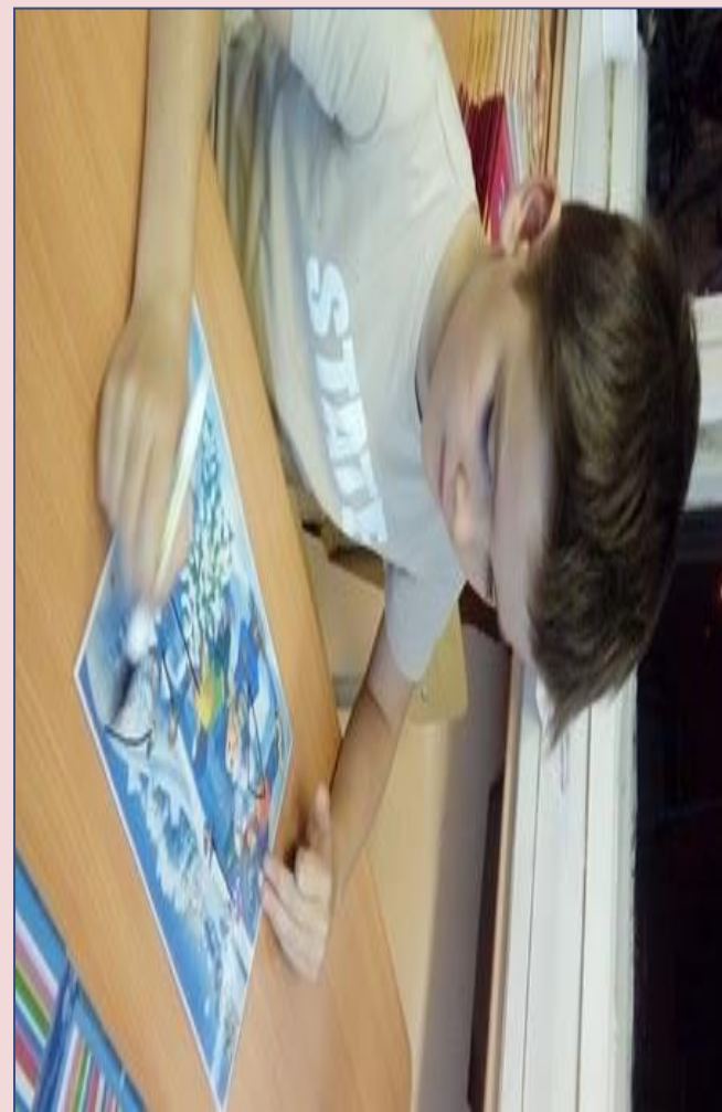
игра «ищу друзей»