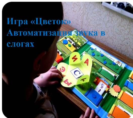
Игра «Цветок» Автоматизация звука в слогах