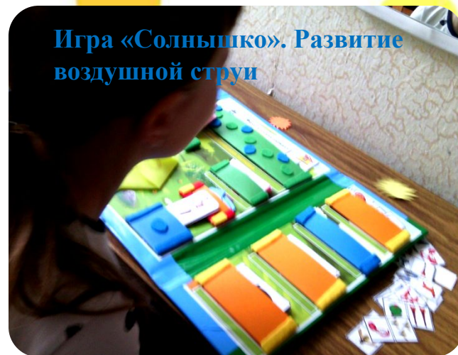
Игра «Солнышко». Развитие воздушной струи