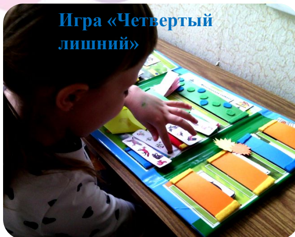
Игра «Четвертый лишний»