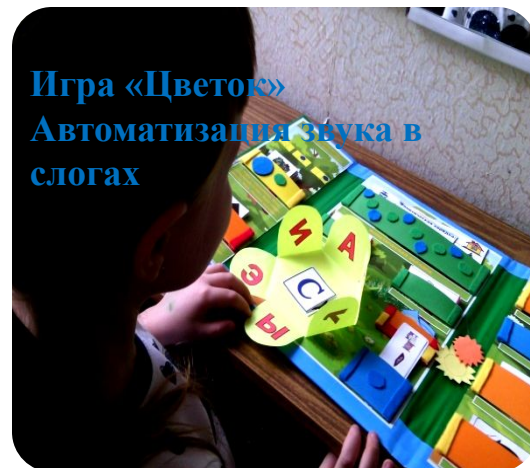
Игра «Цветок» Автоматизация звука в слогах