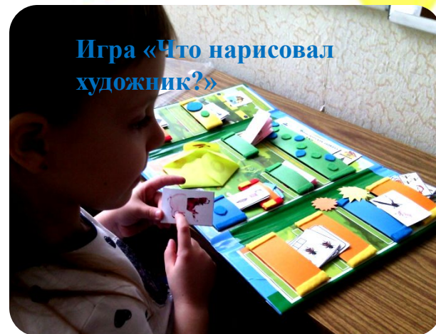
Игра «Что нарисовал художник?»