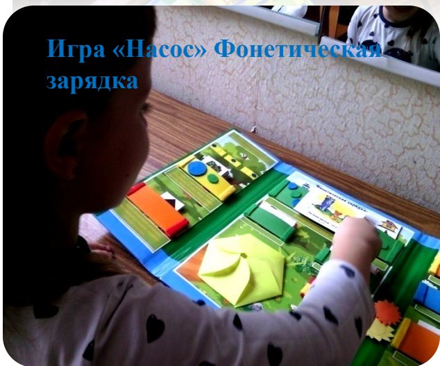
Игра «Насос» Фонетическая зарядка