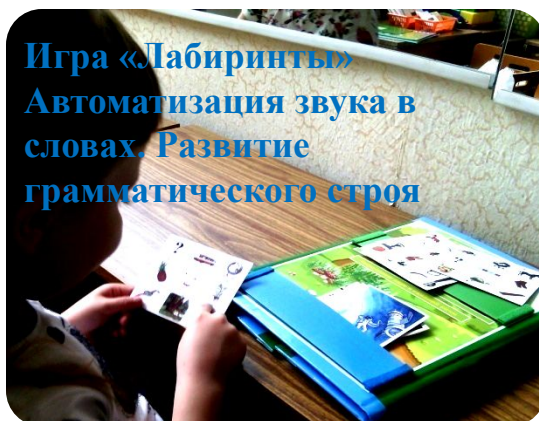
Игра «Лабиринты» Автоматизация звука в словах. Развитие грамматического строя