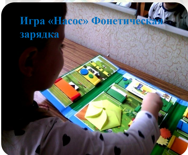
Игра «Насос» Фонетическая зарядка