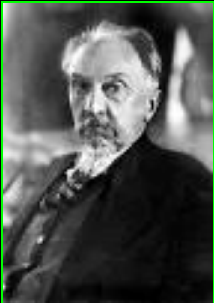
Лев Владимиро вич Щерба (1880-1944)