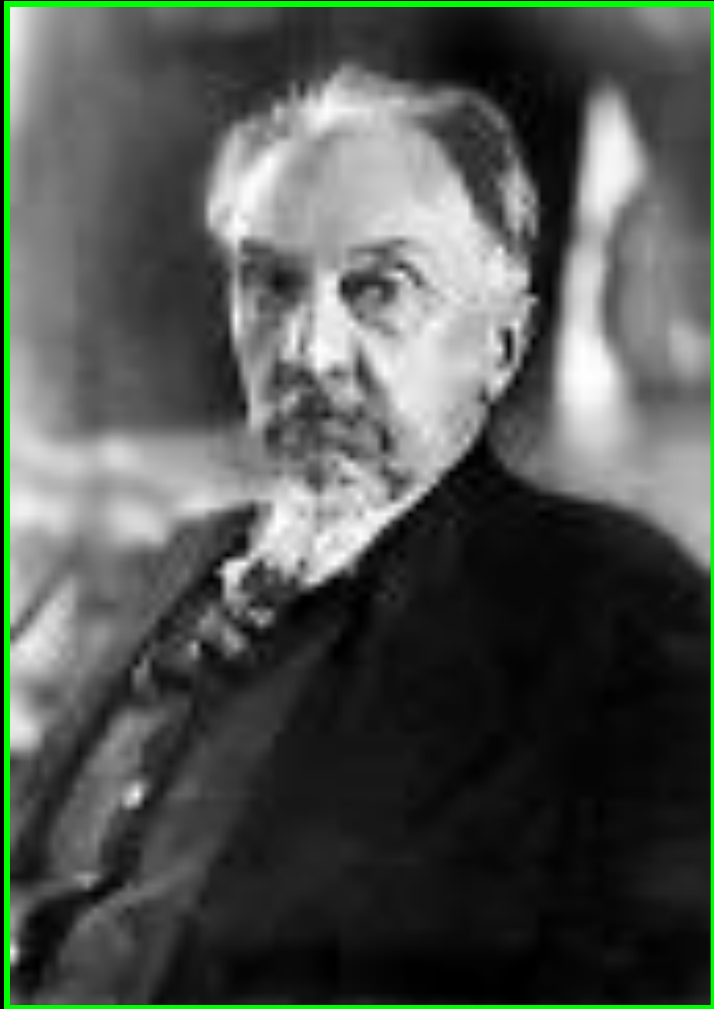
Лев Владимиро вич Щерба (1880-1944)