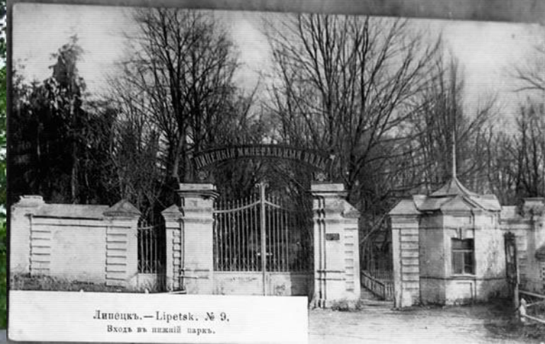
Липецк. — Lipetsk. № 9. Вход в нижний парк.