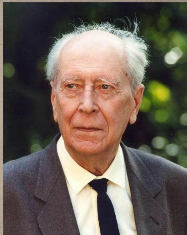
Академик Дмитрий Сергеевич Лихачев

«Если человек не любит хотя бы изредка посмотреть на старые фотографии своих родителей, не ценит память о них, оставленную в саду, который они возделывали, вещах, которые им принадлежали, - значит, он не любит их. Если человек не любит старые улицы, пусть даже и плохонькие, - значит, у него нет любви к своему городу. Если человек равнодушен к памятникам истории своей страны, - он,