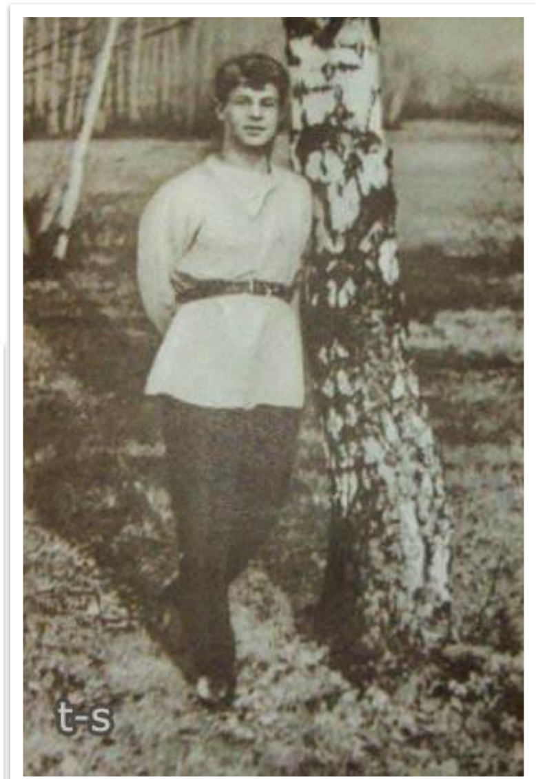
Сергей Есенин у березы. Фото - 1918 год