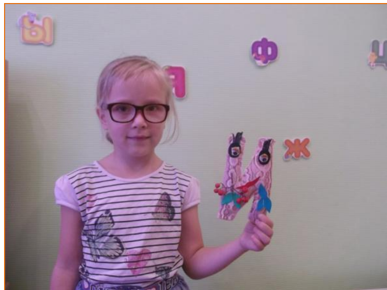
Изящная - И