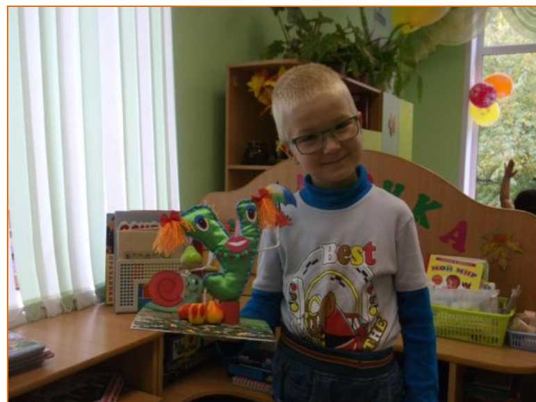
Увлекательная - У