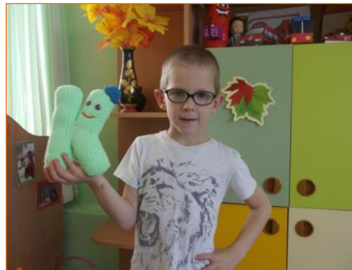
Классная – К