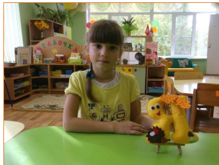
Яркая - Я