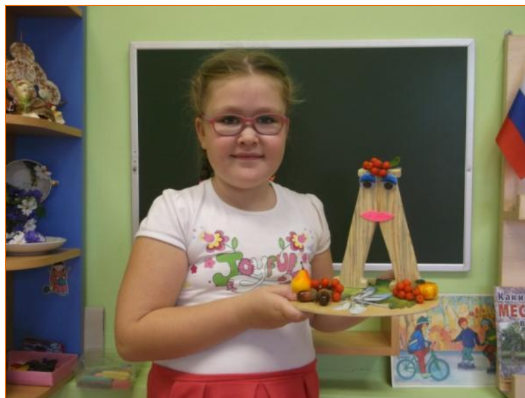
Ласковая - Л