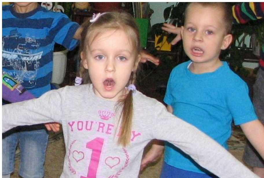
Артикуляционное упражнение «Грибок»

На Лошадке мы поедem: - Скок, Скок, И отыщем там Грибок!