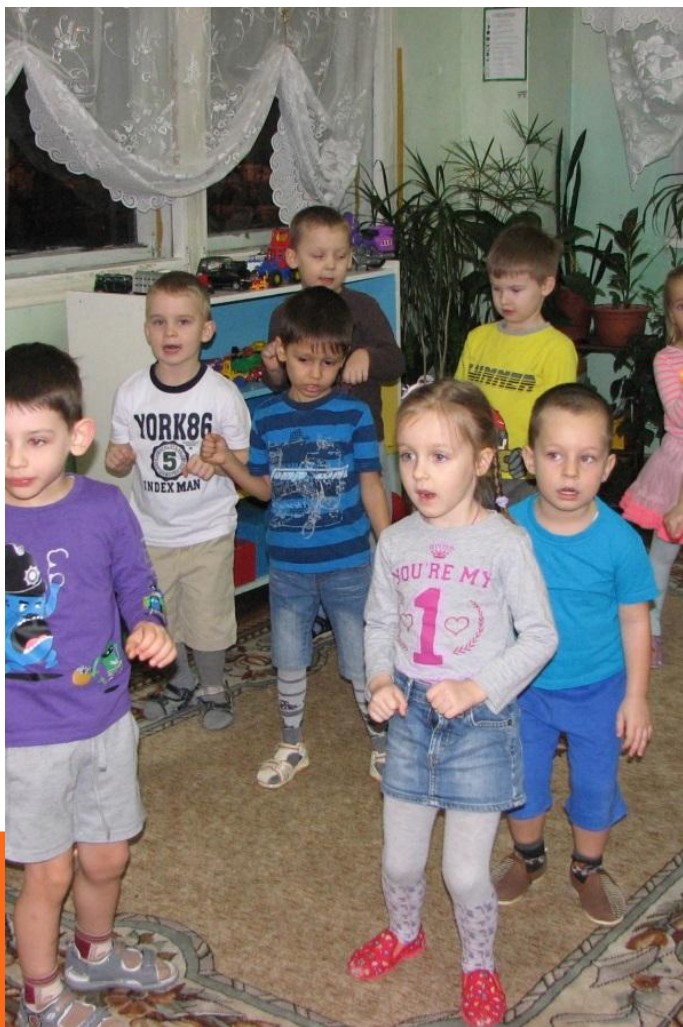
Артикуляционное упражнение «Лошадка»