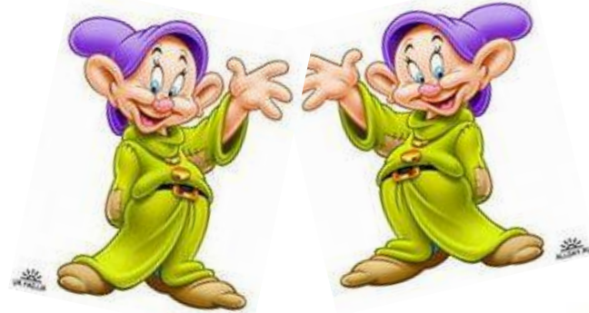
Гномики – близнецы (слова-омонимы)