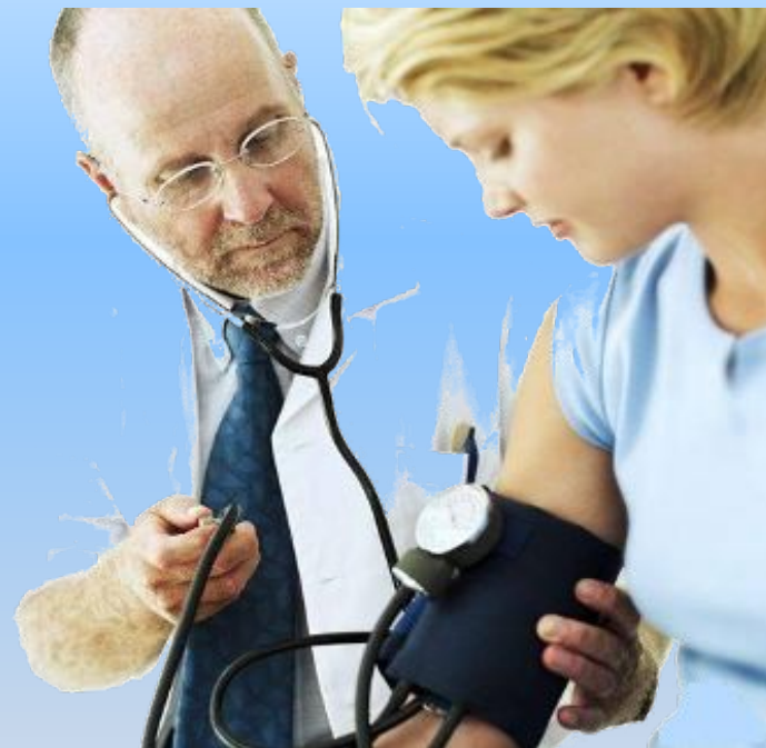
Врач для взрослых (терапевт)