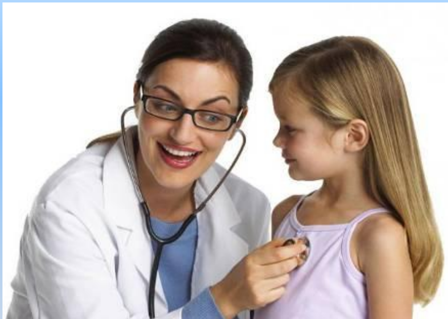
Детский врач (педиатр)