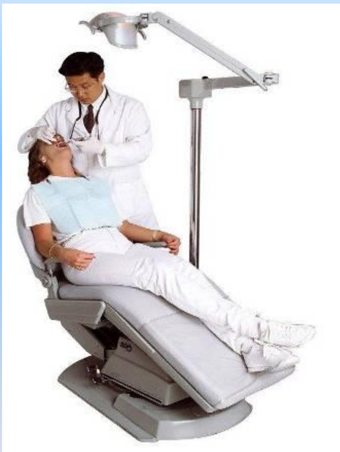
Зубной врач (стоматолог)