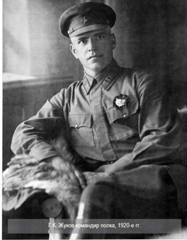
Г. К. Жуков командир полка, 1920-е гг.

В 1915 году был призван в армию, в унтер-офицерском чине участвовал в Первой мировой войне.