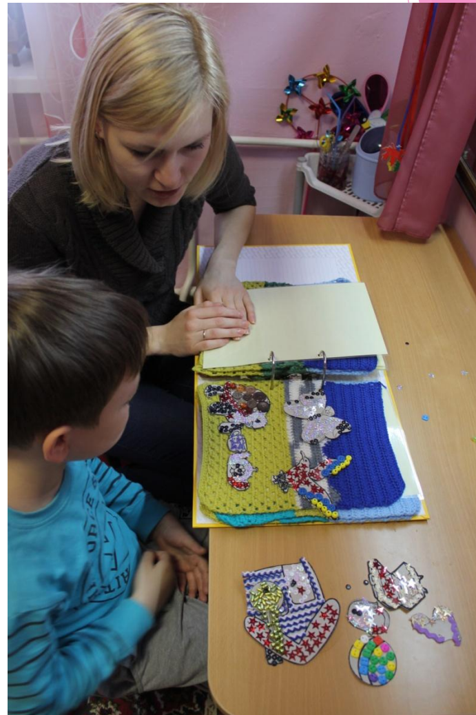
Диалогическая, монологическая речь