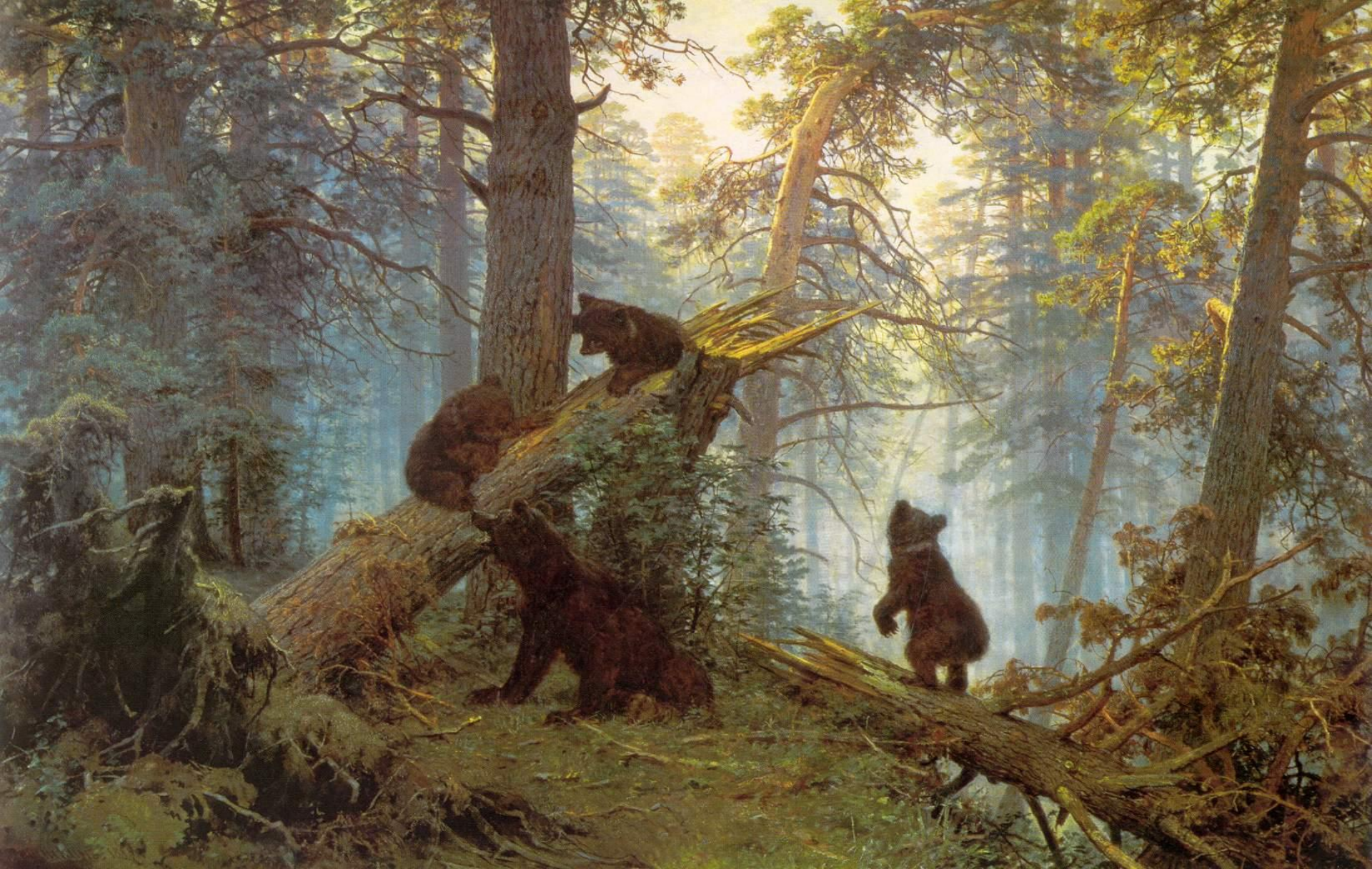
«Утро в сосновом бору» И.Шишкин