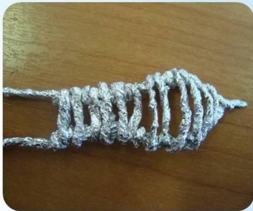
загибая и зацепляя за другое основание