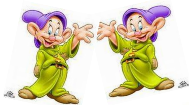
Гномики – близнецы (слова-омонимы)