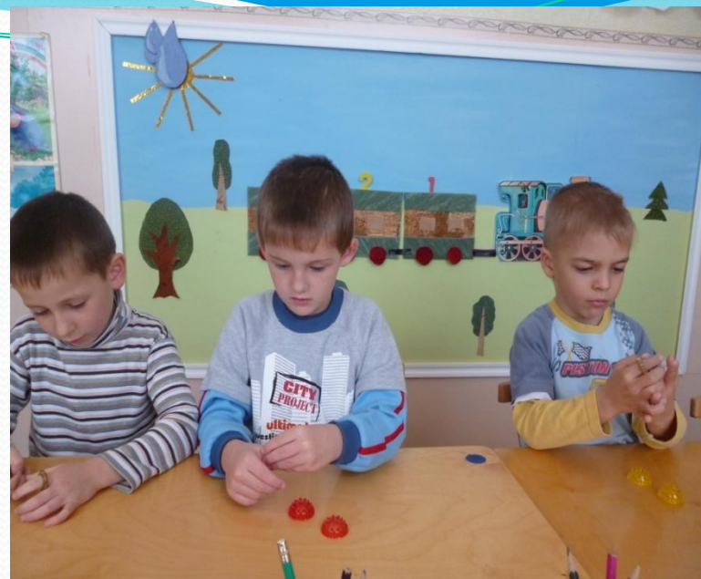
Сухой бассейн «Грецкий орешек».