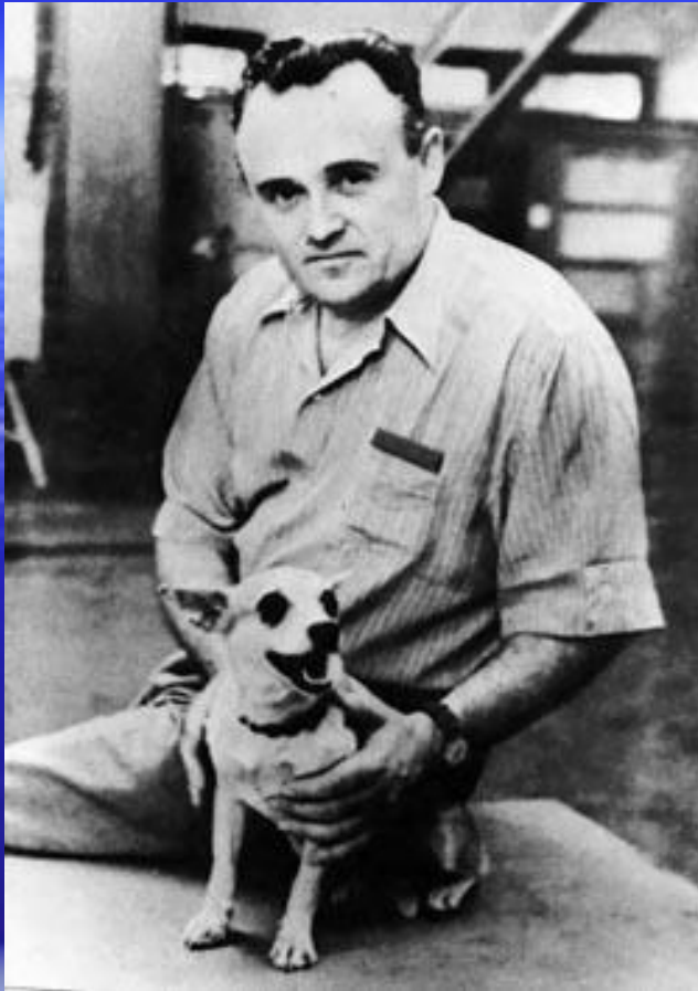
Сергей Павлович Королев