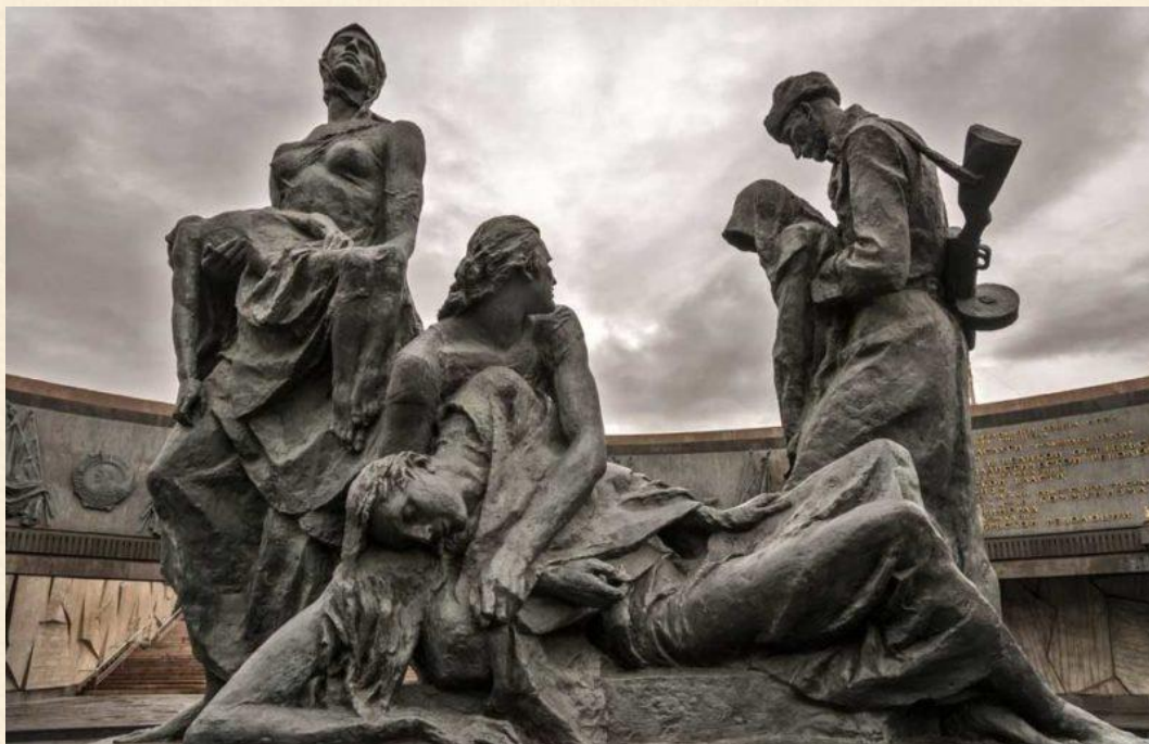
Скульптурные группы «Победители» и «Блокада»