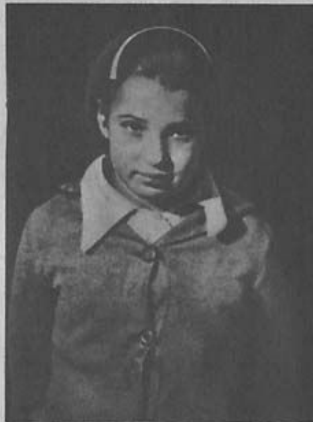
Таня Савичева. Фрагмент группового снимка