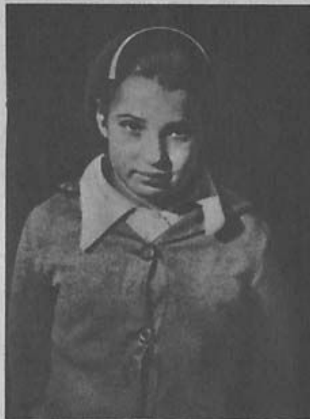
Таня Савичева. Фрагмент группового снимка