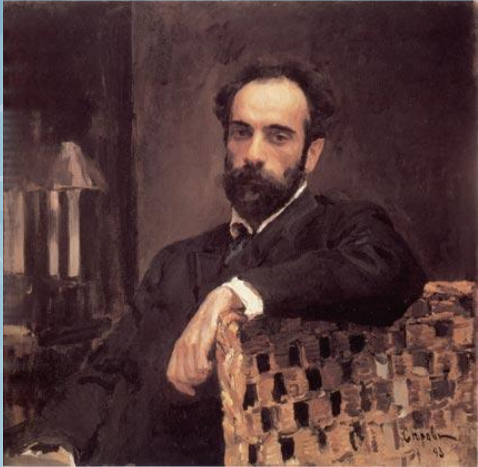
Портрет художника Исаака Ильича Левитана. 1893.

«Природу украшать не надо, но надо почувствовать ее суть...» (И.И. Левитан.)