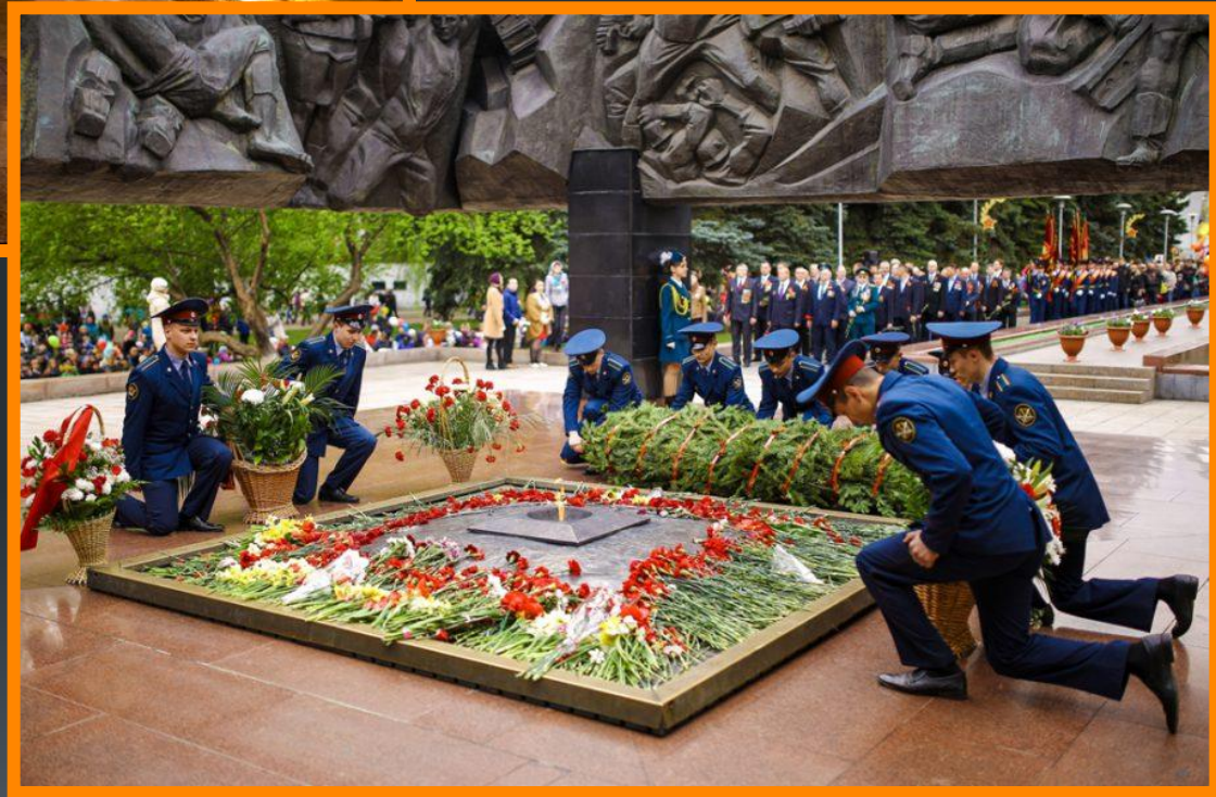
Мемориальный комплекс «Бульвар Героев» (Россия, Новокузнецк)