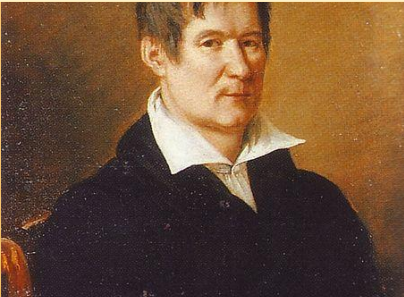
Василий Петрович Стасов