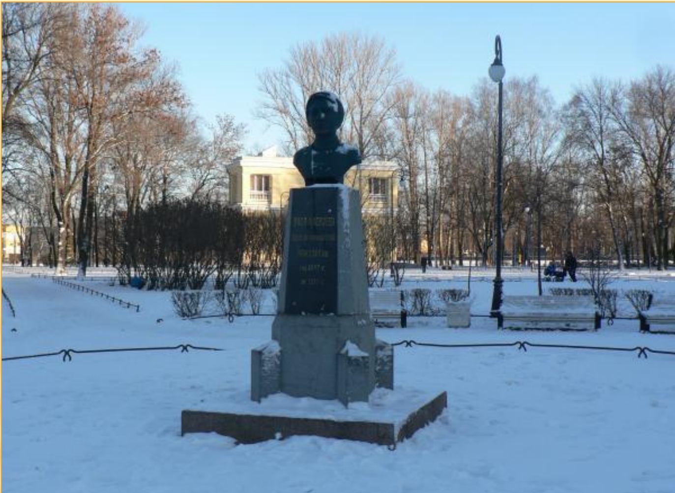
памятник В.П. Алексееву