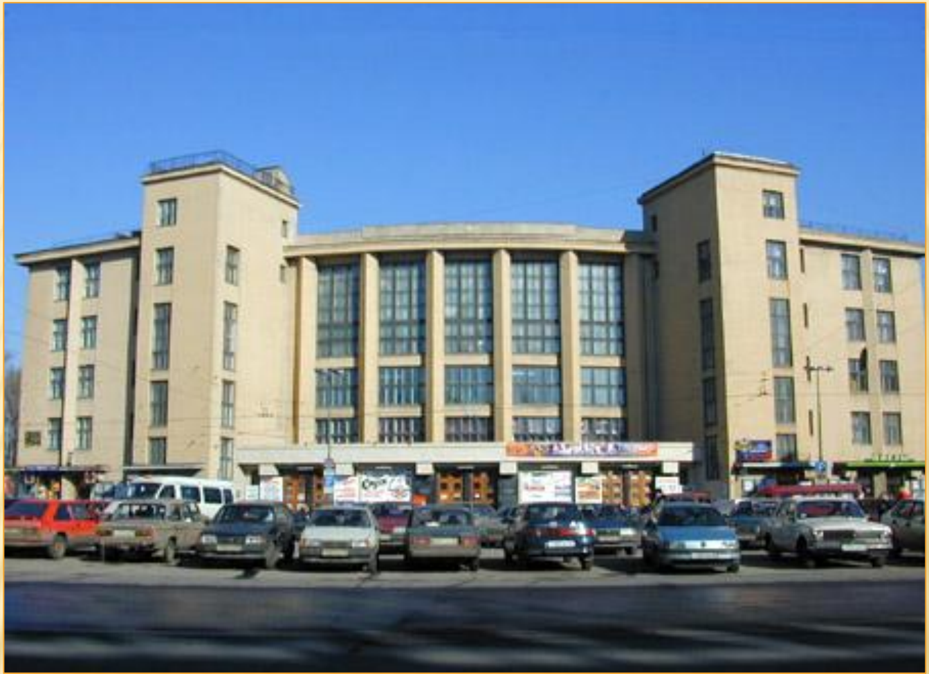
Дворец культуры имени А. М. Горького