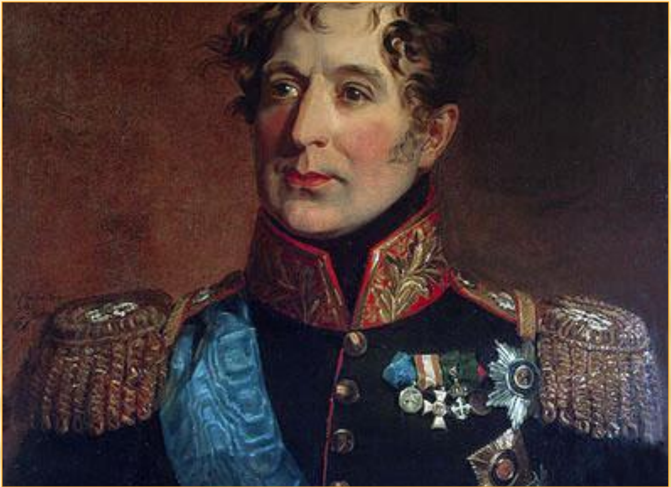
генерал-губернатор М.А. Милорадович