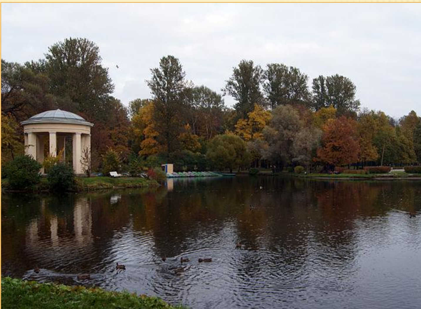
Приморские усадьбы - Екатеринбург, Анненгоф, Елизаветгоф, Стрельна