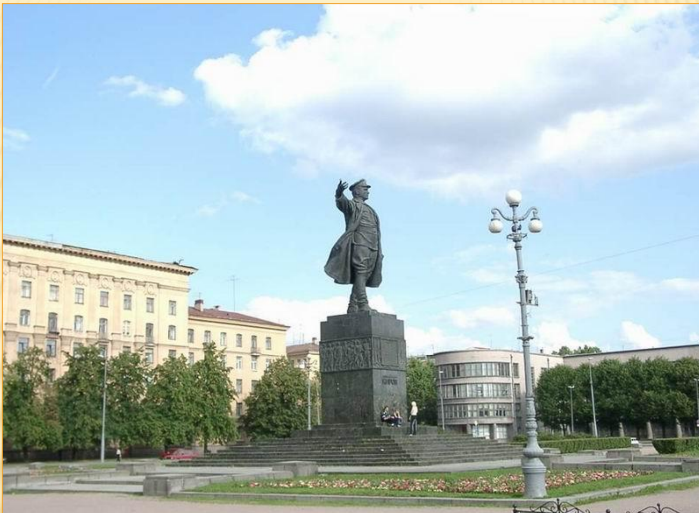
Памятник С.М. Кирову