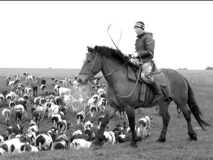
Мөрэр мал хэрүлнэ.