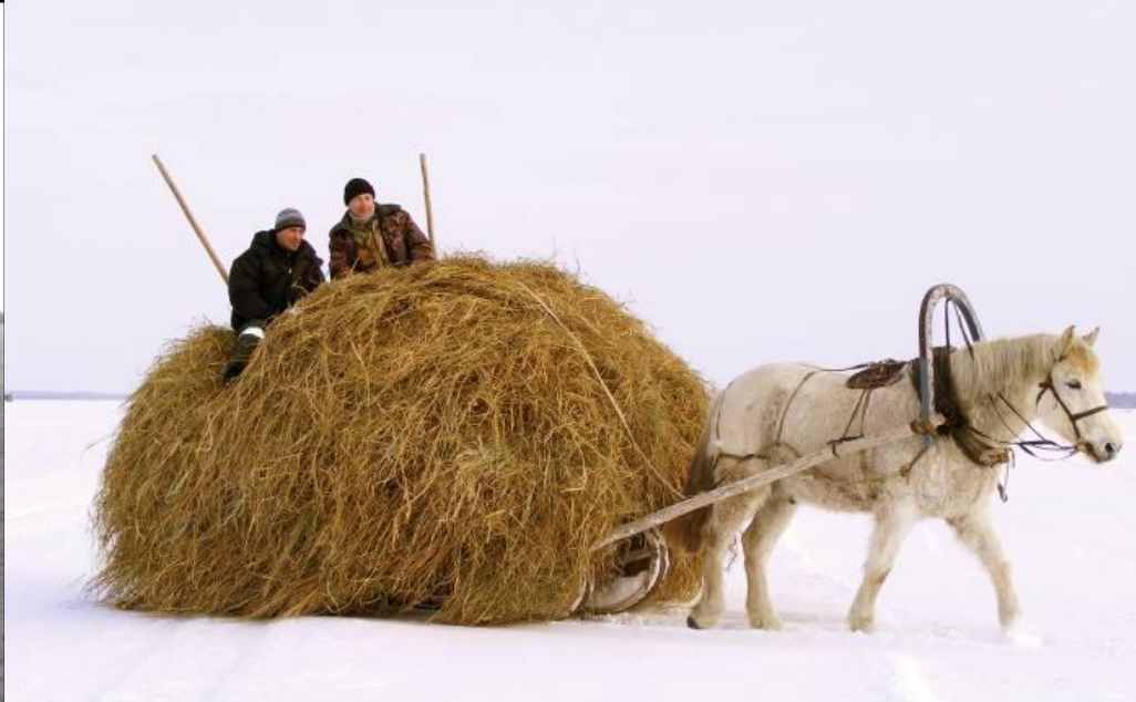
Мөрэр аца зөөнэ.