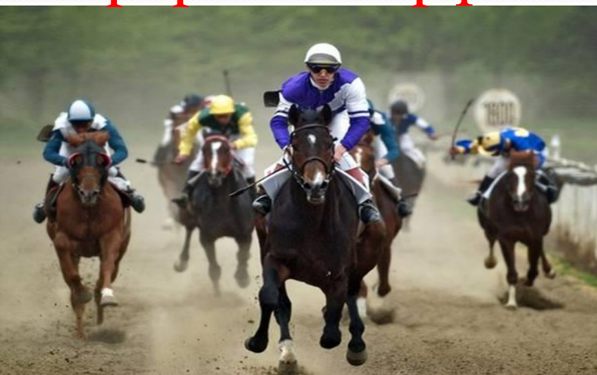
Мөрн урлданд орна.