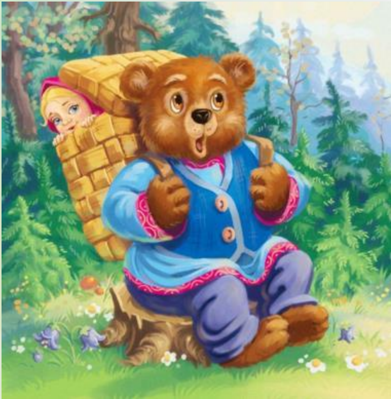
Маша и медведь