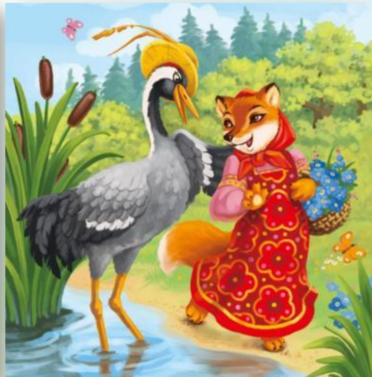
Лиса и журавль