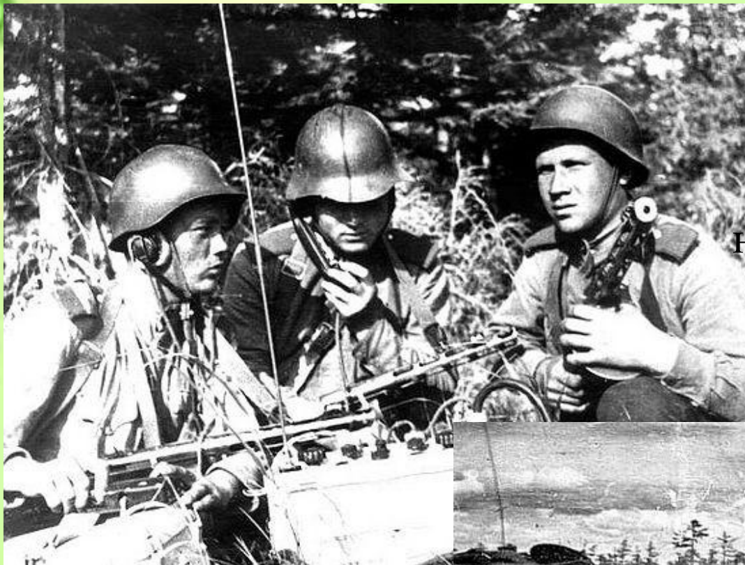
Южно-Сахалинская наступательная операция. Советские бойцы.