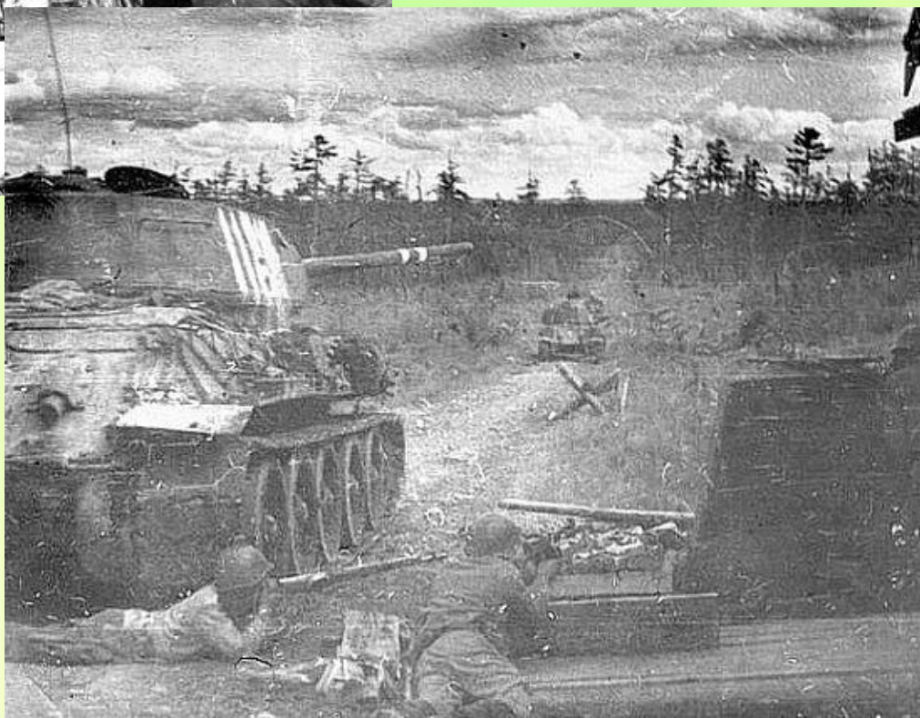
Советский танк Т-34 в боях за юг Сахалина