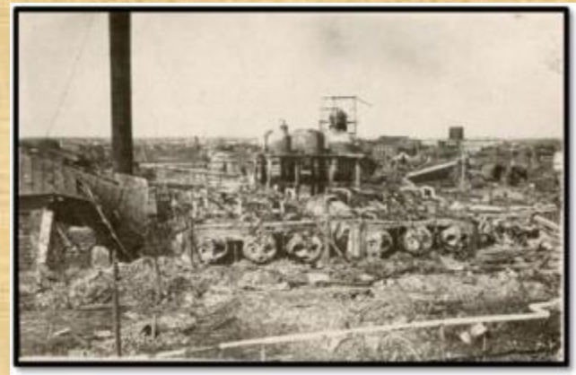
Завод им. Седина после оккупации