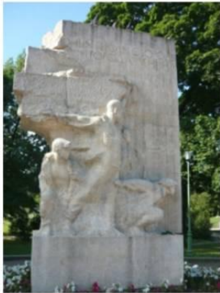
Памятник пионерам - героям В Таврическом саду