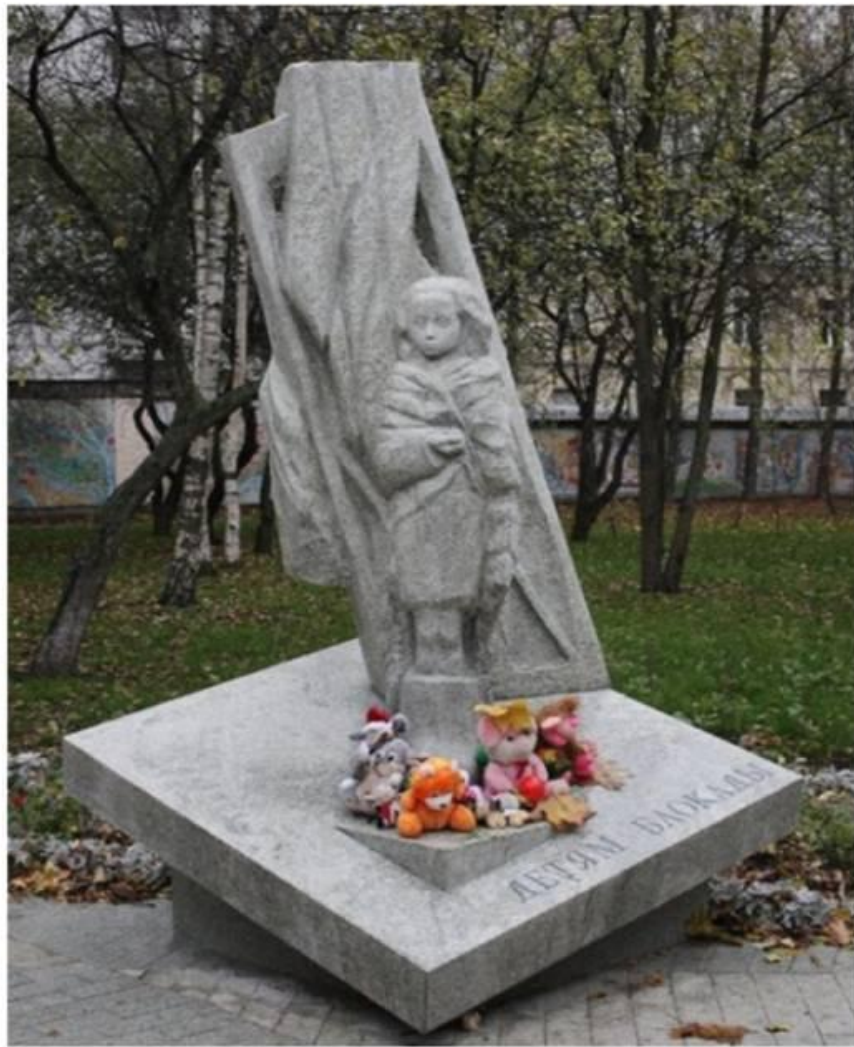
Памятник «Дети блокады» на Васильевском острове