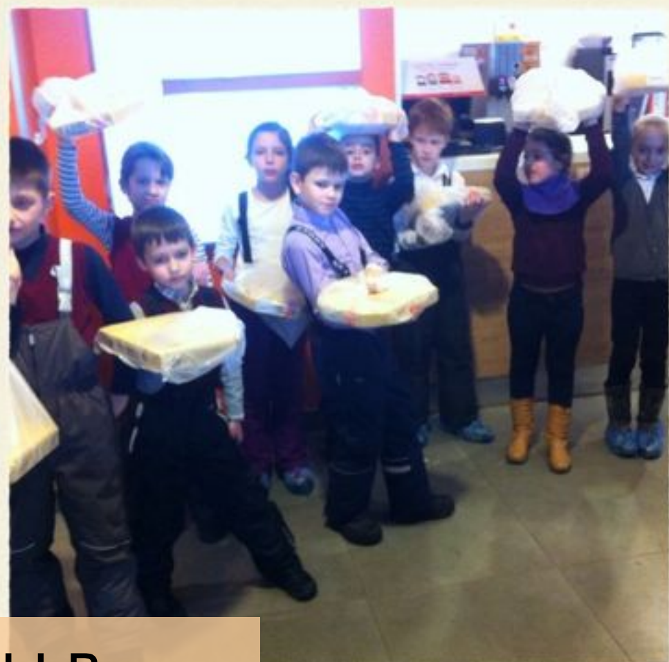
Мастер-классы в пиццерии