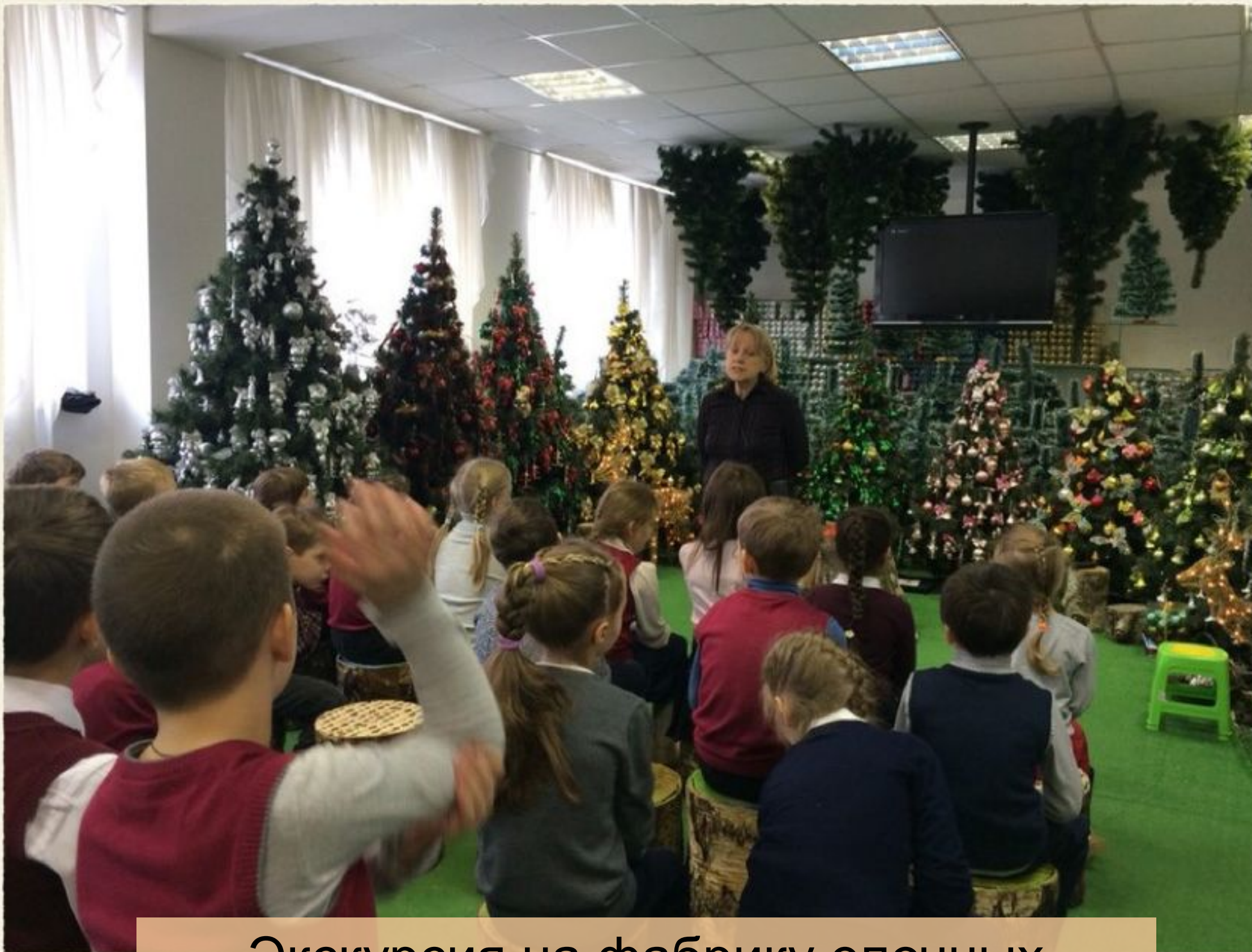
Экскурсия на фабрику елочных игрушек