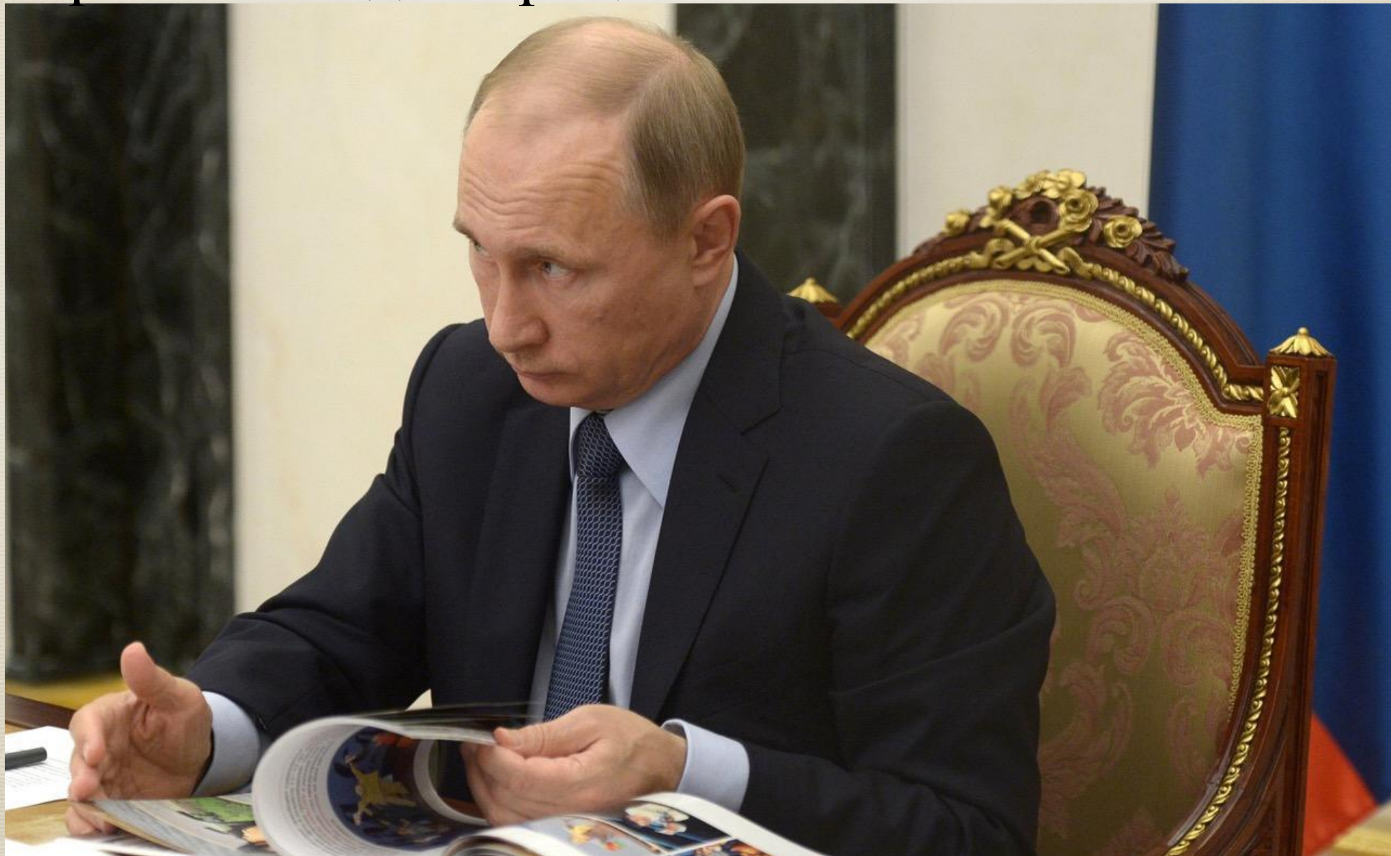
В.В.Путин смотрит страницу с описанием методики

25 декабря 2015 года рабочая группа Экспертного совета Агентства стратегических инициатив (АСИ) единогласно приняла решение об официальной поддержке проекта Центра развития образования имени И.Г. Песталоцци "Образование для процветания. Начальная школа".