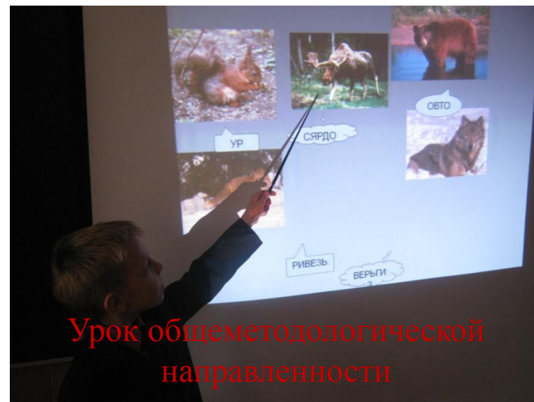
Урок общеметодологической направленности