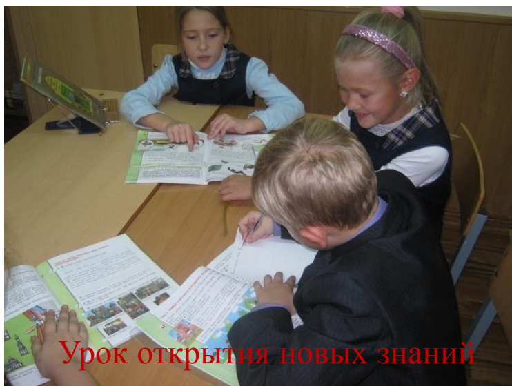
Урок открытия новых знаний