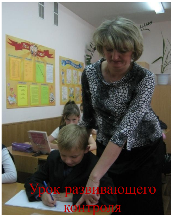
Урок развивающего контроля