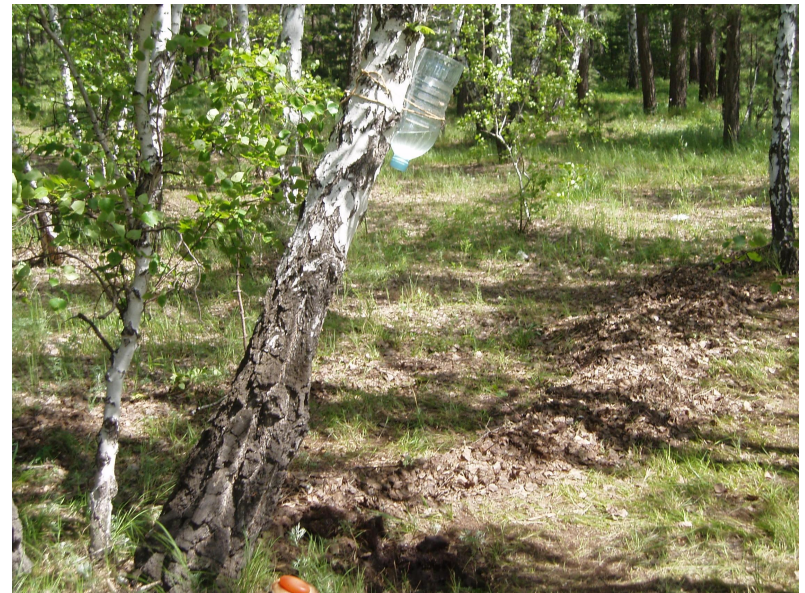
Туристские самоделки (умывальник) МОУ «ЧСОШ №1»