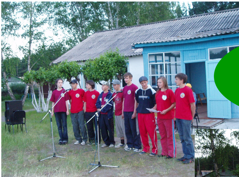
Команда МОУ «Иртышская СОШ»