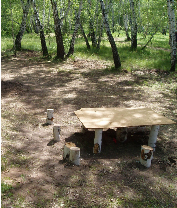
Обеденная зона команды МОУ «ЧСОШ №1»