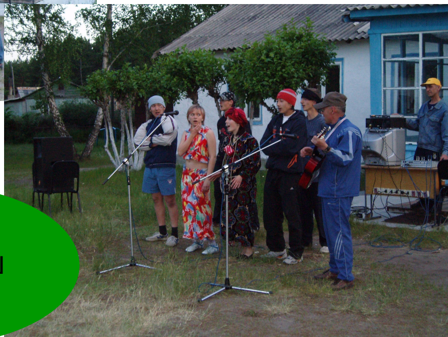
Команда МОУ «ЧСОШ №1»