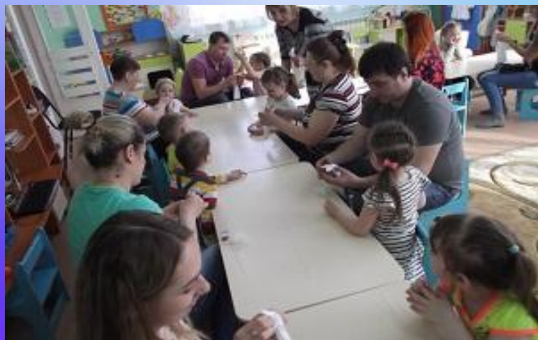
Тема: «Развитие творческих способностей у детей»