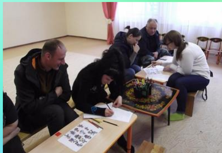
Тема: «Развитие связной речи посредством мнемотехники»