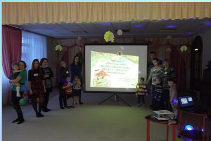
Тема: «Семейные традиции»