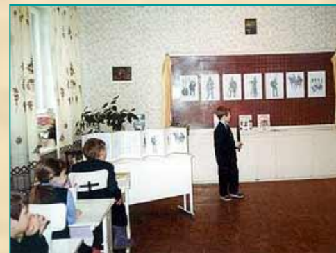
Средняя школа № 5, г. Петрозаводск