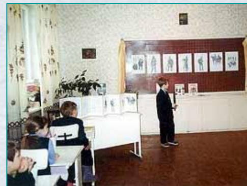
Средняя школа № 5, г. Петрозаводск