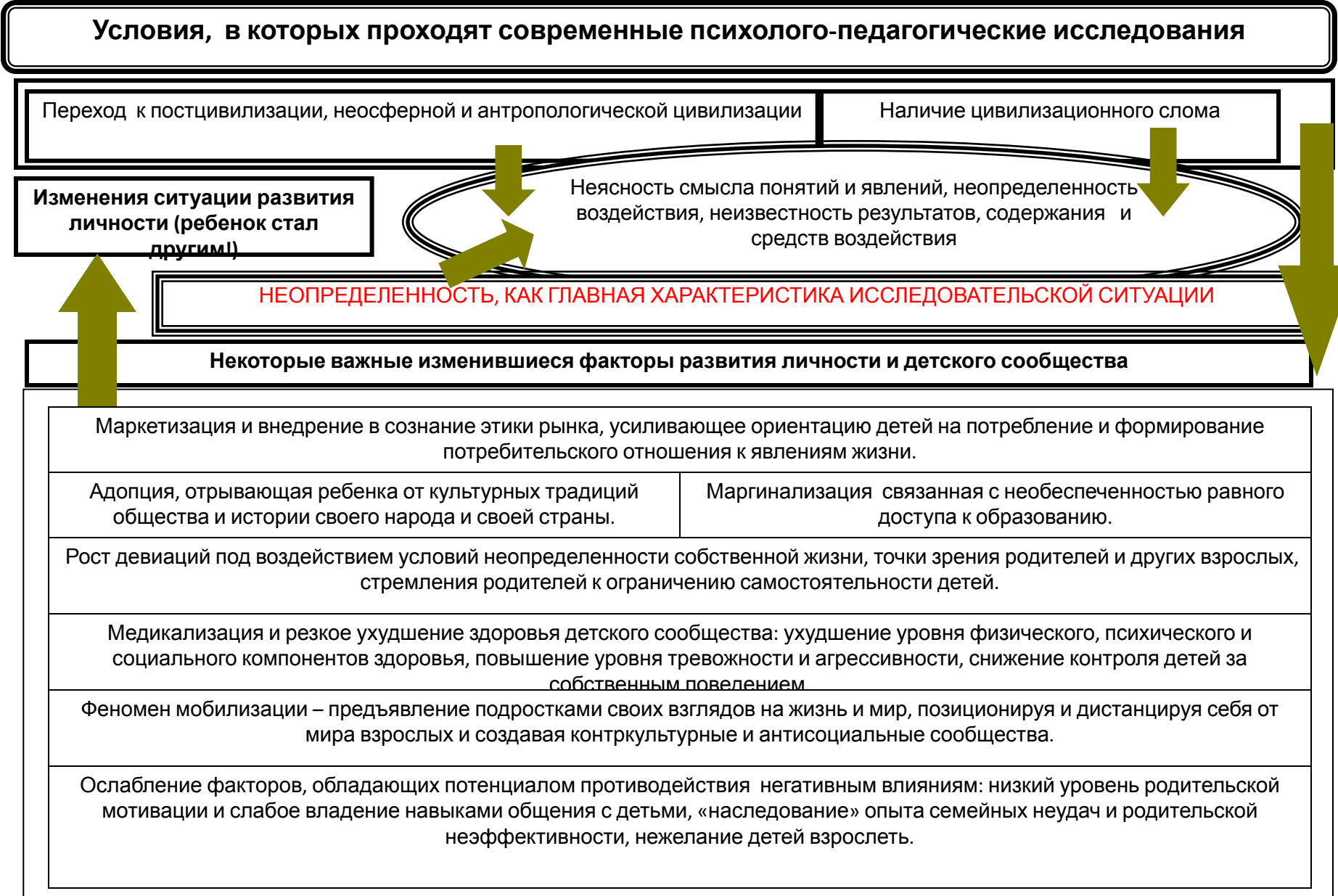
Рис. 54. Характеристика внешних условий проведения научных исследований в области педагогики (по Д.И. Фельдштейну, 2009)