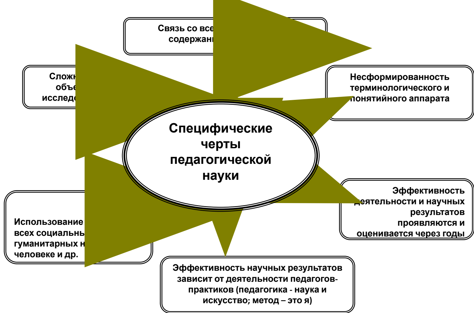
Рис. 50. Специфические черты педагогики как науки