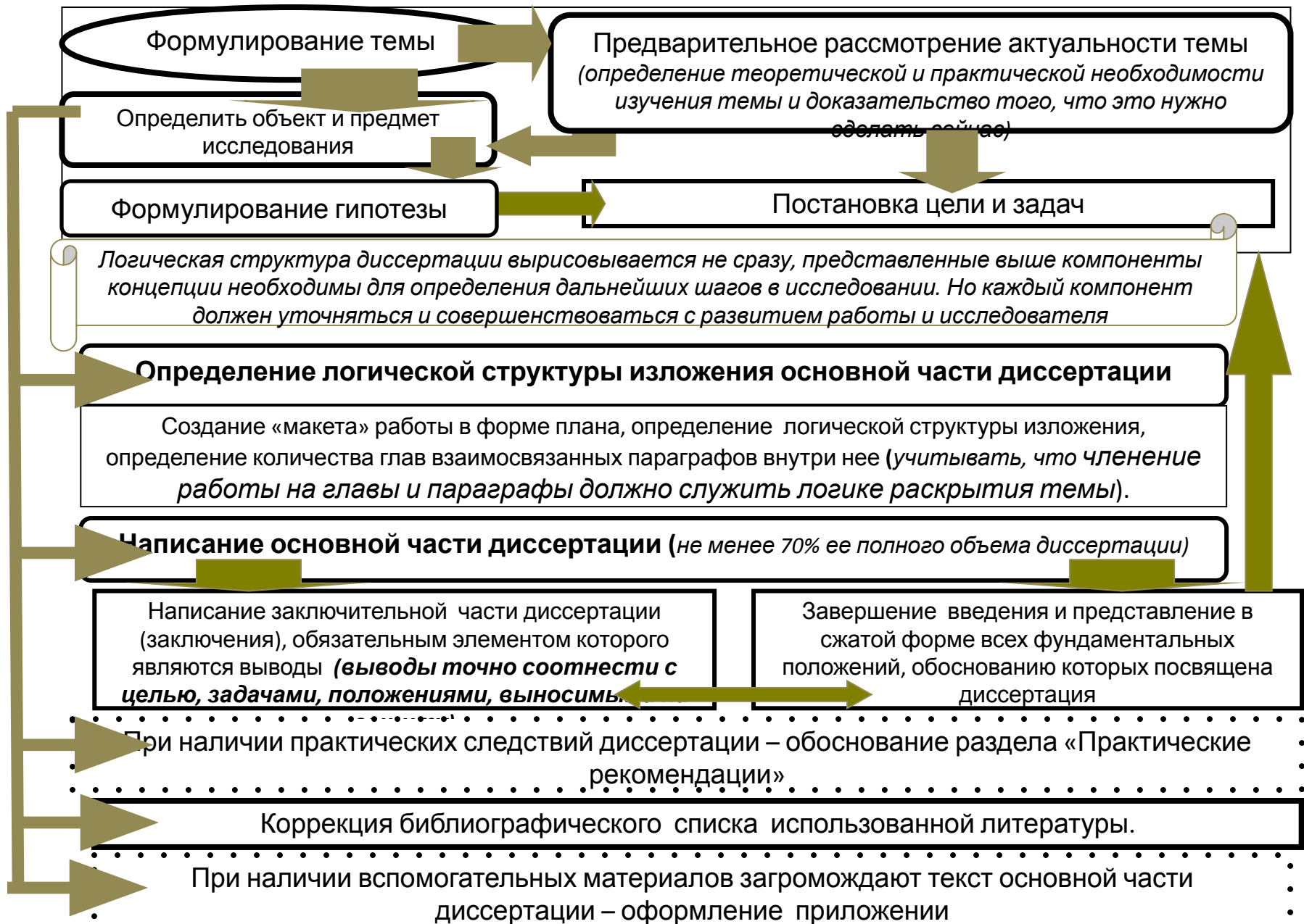
Рис. 140. Логическая последовательность работы над диссертацией