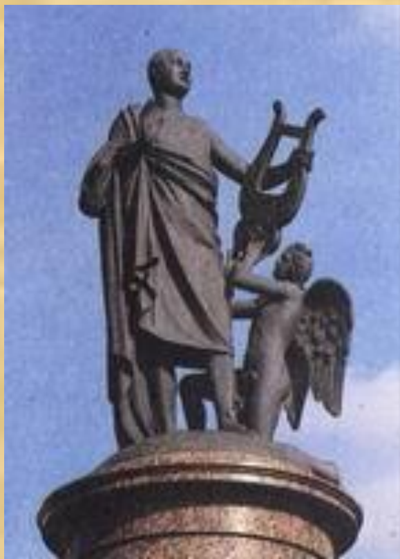
Памятник Ломоносову в г. Архангельске