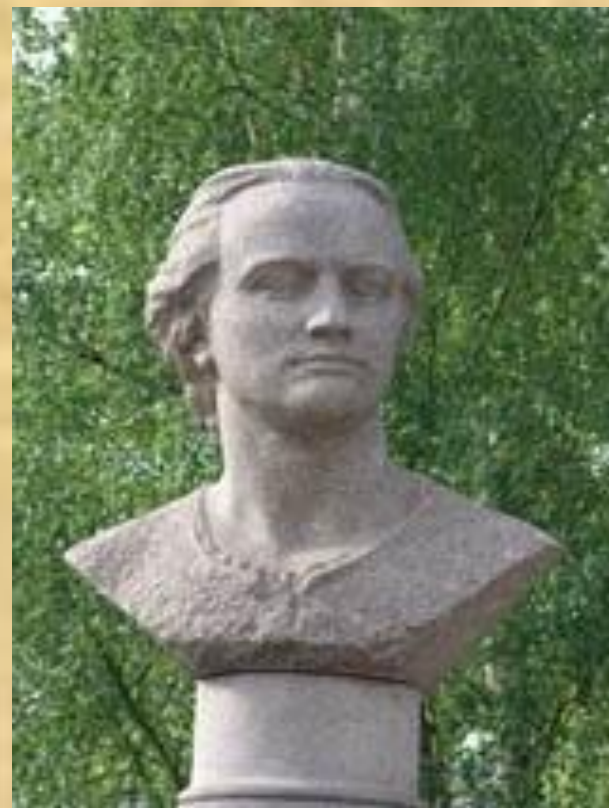
Памятник Ломоносову в г. Архангельске у ПГУ им М.В.Ломоносова