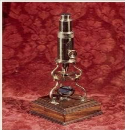
Микроскоп XVIII в. Металл. М.В.Ломоносов, Ленинград

Ломоносов считал химию своей «главной профессией», причем развитие химии, по мнению ученого, должно было помочь решению практических задач. «Истинный химик должен быть теоретиком и практиком», — писал он. Став профессором химии, Ломоносов начал добиваться создания химической лаборатории.