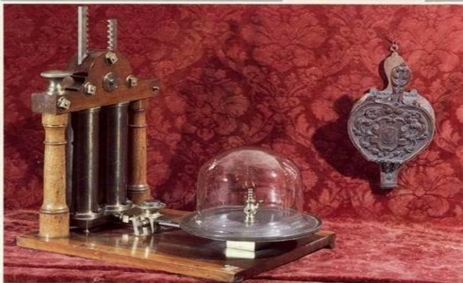
Вальцовый пресс XVIII в. Металл. М.В.Ломоносов, Ленинград

Вещи из химической лаборатории М.В.Ломоносова