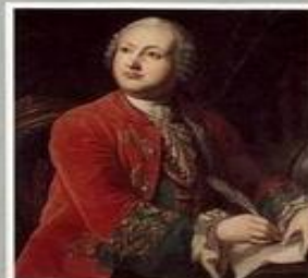
М.В.Ломоносов. Неизвестный художник XVIII в. Архангельский областной краеведческий музей

Ломоносов считал химию своей «главной профессией», причем развитие химии, по мнению ученого, должно было помочь решению практических задач. «Истинный химик должен быть теоретиком и практиком», — писал он. Став профессором химии, Ломоносов начал добиваться создания химической лаборатории.