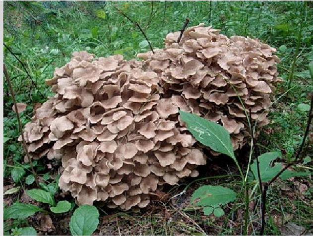
ГРИБ - БАРАН