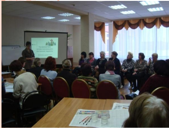
Семинар-практикум по профилактике педагогического выгорания

Цель : охрана и укрепление здоровья учащихся, приобщение их к ценностям здорового образа жизни.