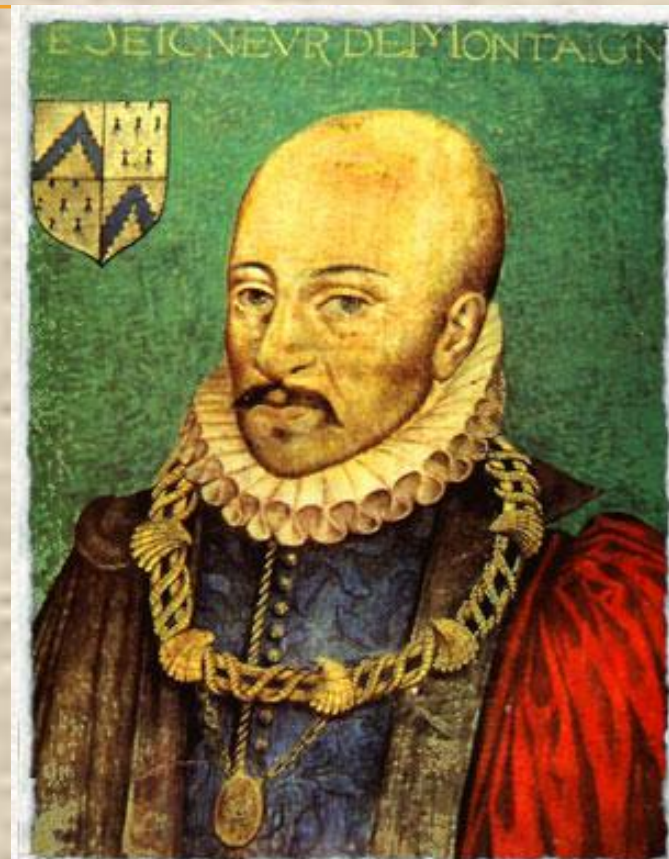
Мишель де Монтень (1533-1592)