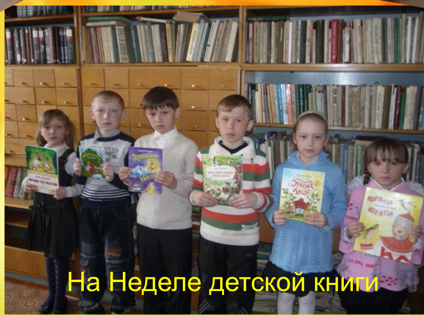
На Неделе детской книги