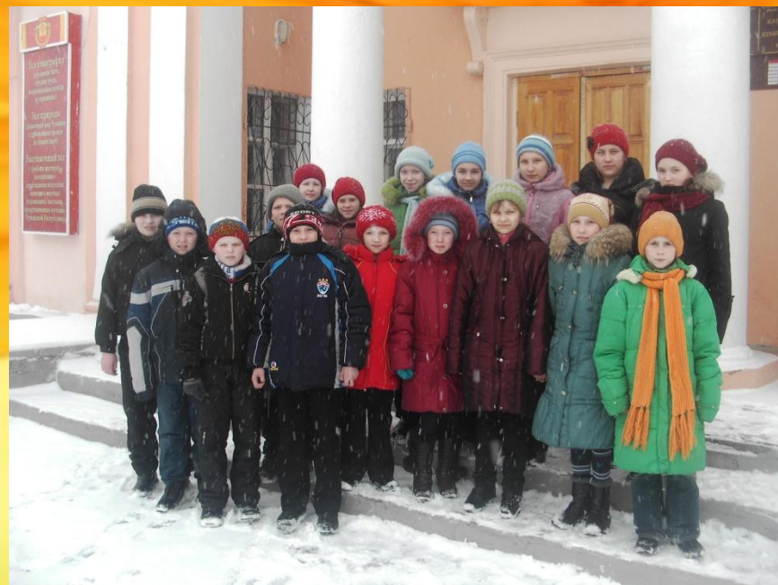
Экскурсия в краеведческий музей г. Канаш