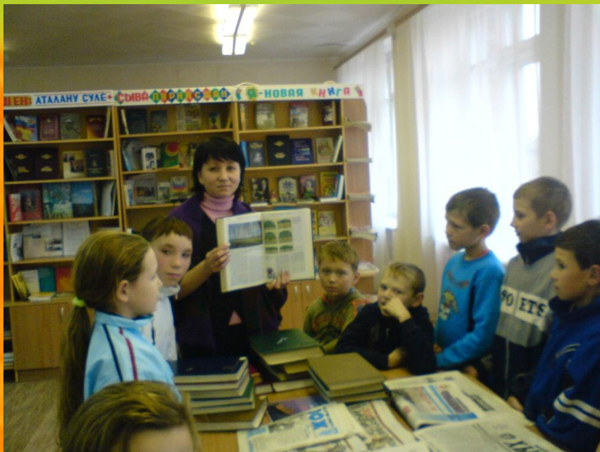
Урок русского языка в сельской модельной библиотеке (6 класс)