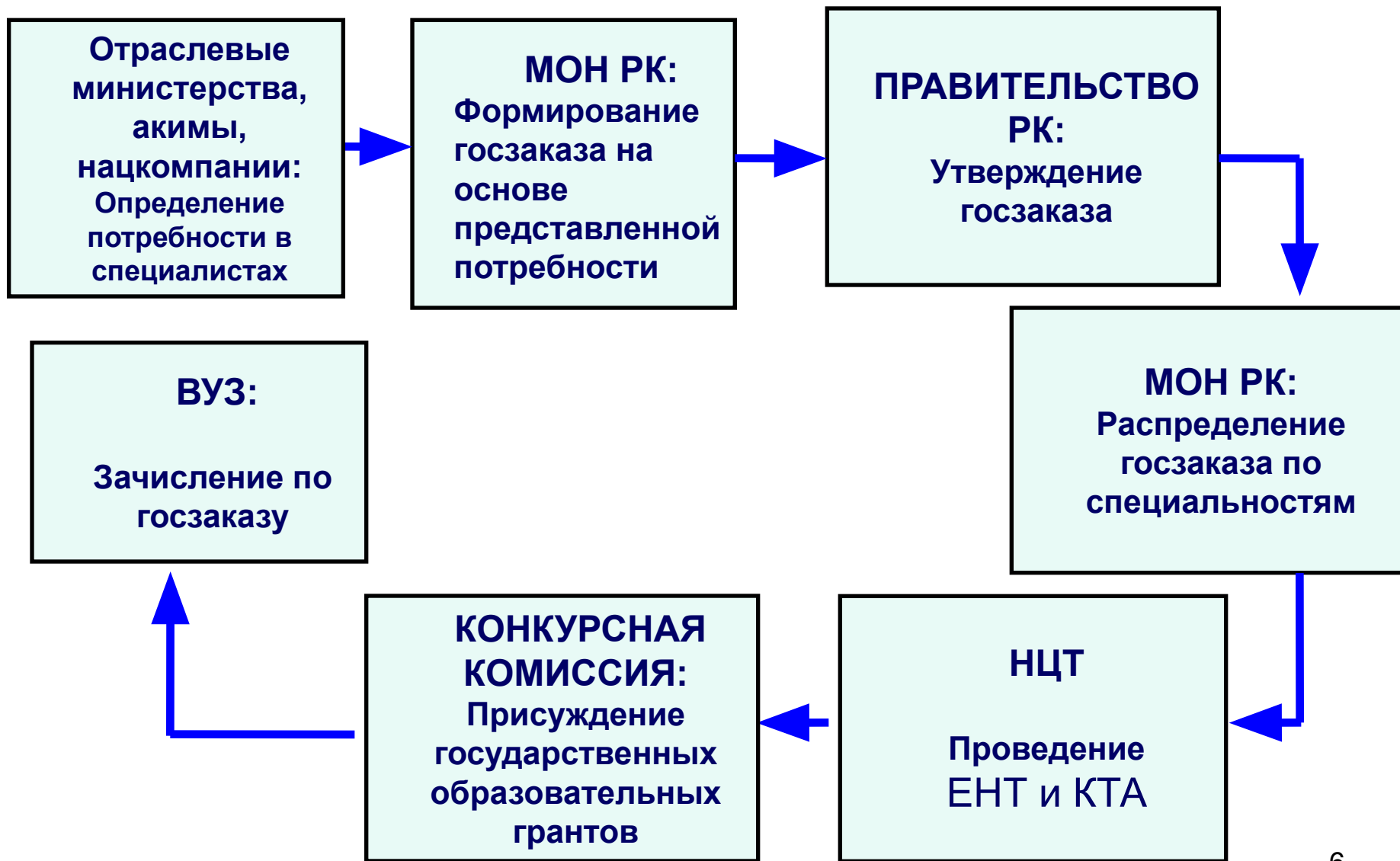
СХЕМА ПРИЕМА В ВУЗЫ НА ОСНОВЕ ГОСЗАКАЗА