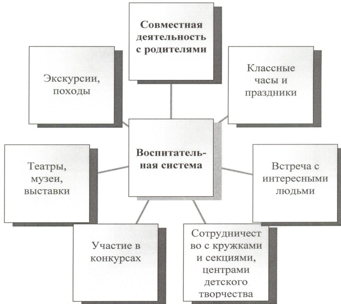
Схема реализации воспитательной системы через деятельность.

Главные направления учебно-воспитательной работы - нравственное и экологическое воспитание.