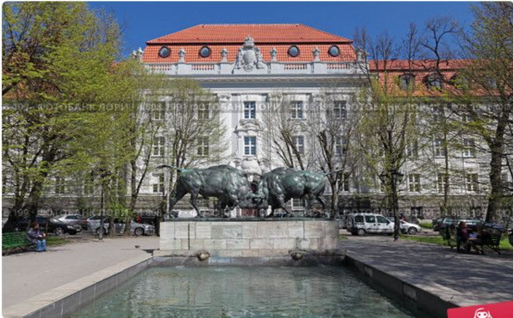
Скульптура "Борющиеся зубры", город Калининград

Открытие бронзовой скульптуры состоялось 12 ноября 1912 года. Её автор – скульптор Август Гауль.