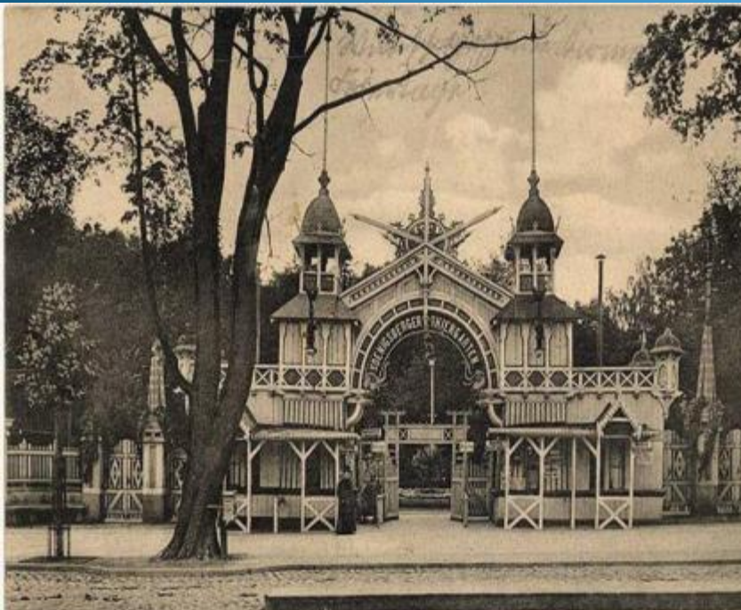
Königsberg i. Pr. Eingang zum Tiergarten.