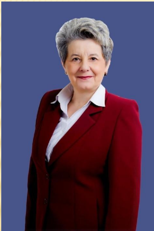
МЭР - НАДЕЖДА НИКОЛАЕВНА КАЧАН