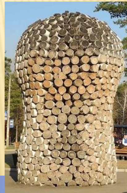
ТРК «ПОРТ АРТУР»