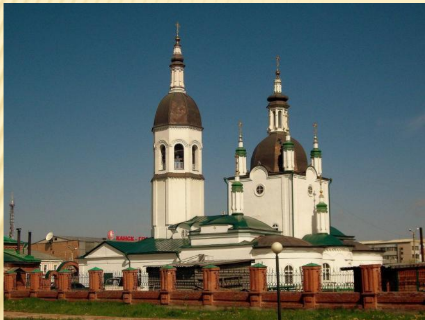
Кафедральный собор Троицы Живоначальной