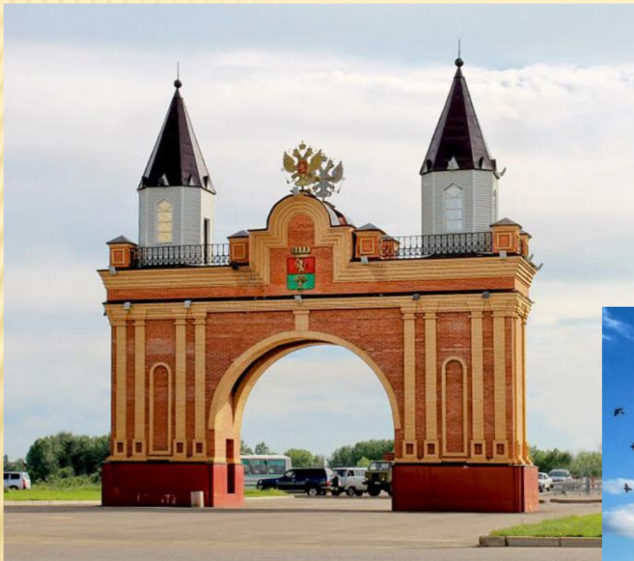
ТРИУМФАЛЬНАЯ АРКА «ЦАРСКИЕ ВРАТА»