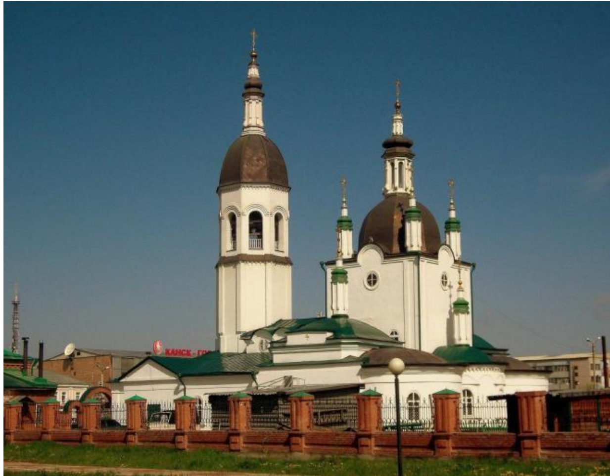
Кафедральный собор Троицы Живоначальной