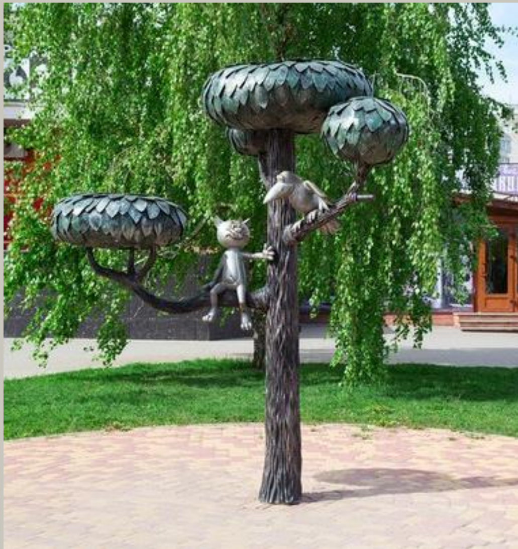
ПАМЯТНИК КОТЁНКУ С УЛИЦЫ ЛИЗЮКОВА