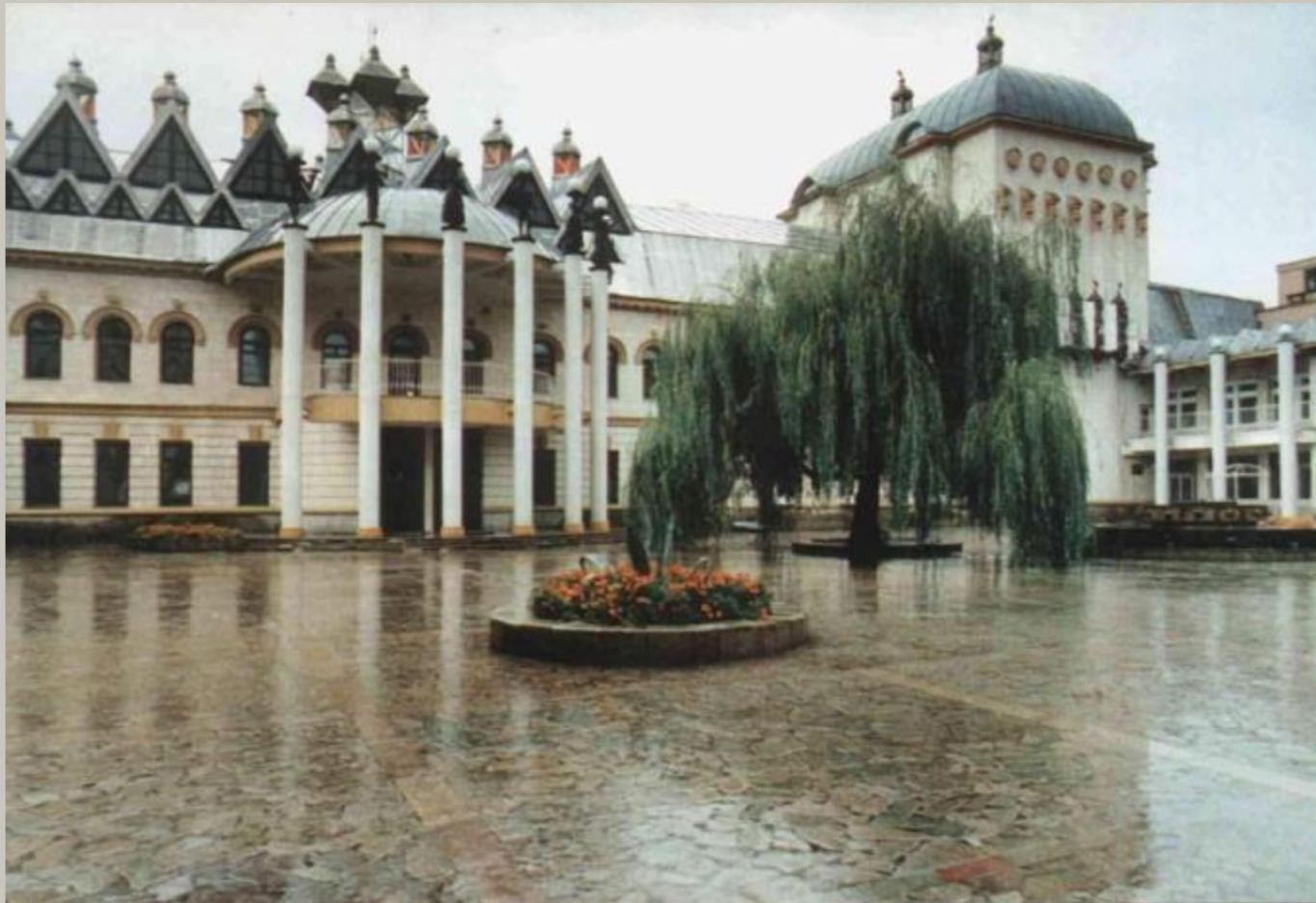
ТЕАТР КУКОЛ «ШУТ»