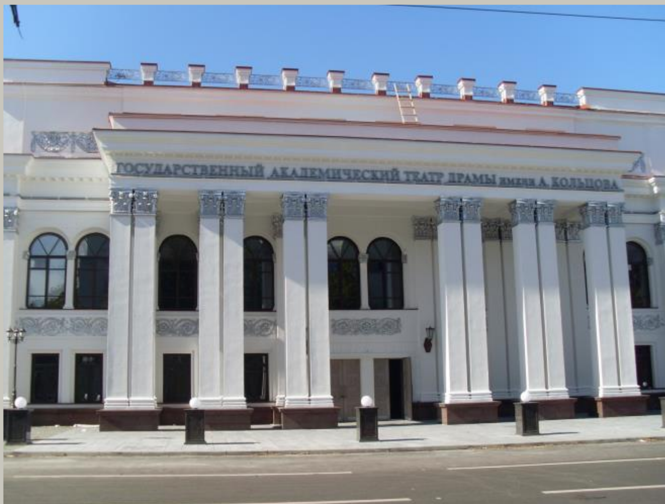
ТЕАТР ДРАМЫ ИМЕНИ АЛЕКСЕЯ КОЛЬЦОВА