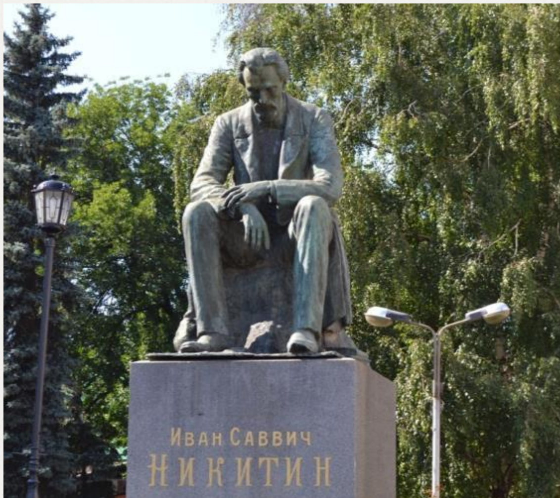
ПАМЯТНИК ИВАНУ НИКИТИНУ