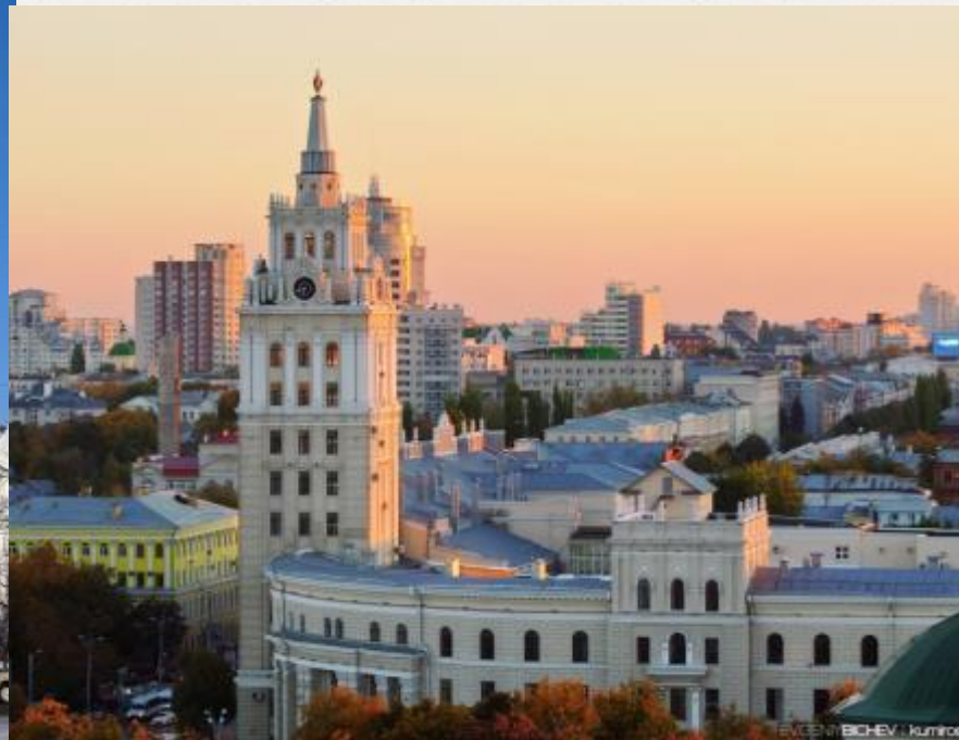
ЗДАНИЕ ОБЛАСТНОГО СОВЕТА ПРОФСОЮЗОВ С МУЗЫКАЛЬНЫМИ ЧАСАМИ НА ПЛОЩАДИ ЛЕНИНА И ЗДАНИЕ УПРАВЛЕНИЯ Ю.В.Ж.Д.