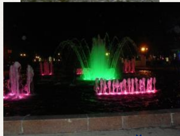
ПАМЯТНИК АЛЕКСЕЮ КОЛЫЦОВУ. МУЗЫКАЛЬНЫЙ ЦВЕТНОЙ ФОНТАН В КОЛЫЦОВСКОЙ СКВЕРЕ