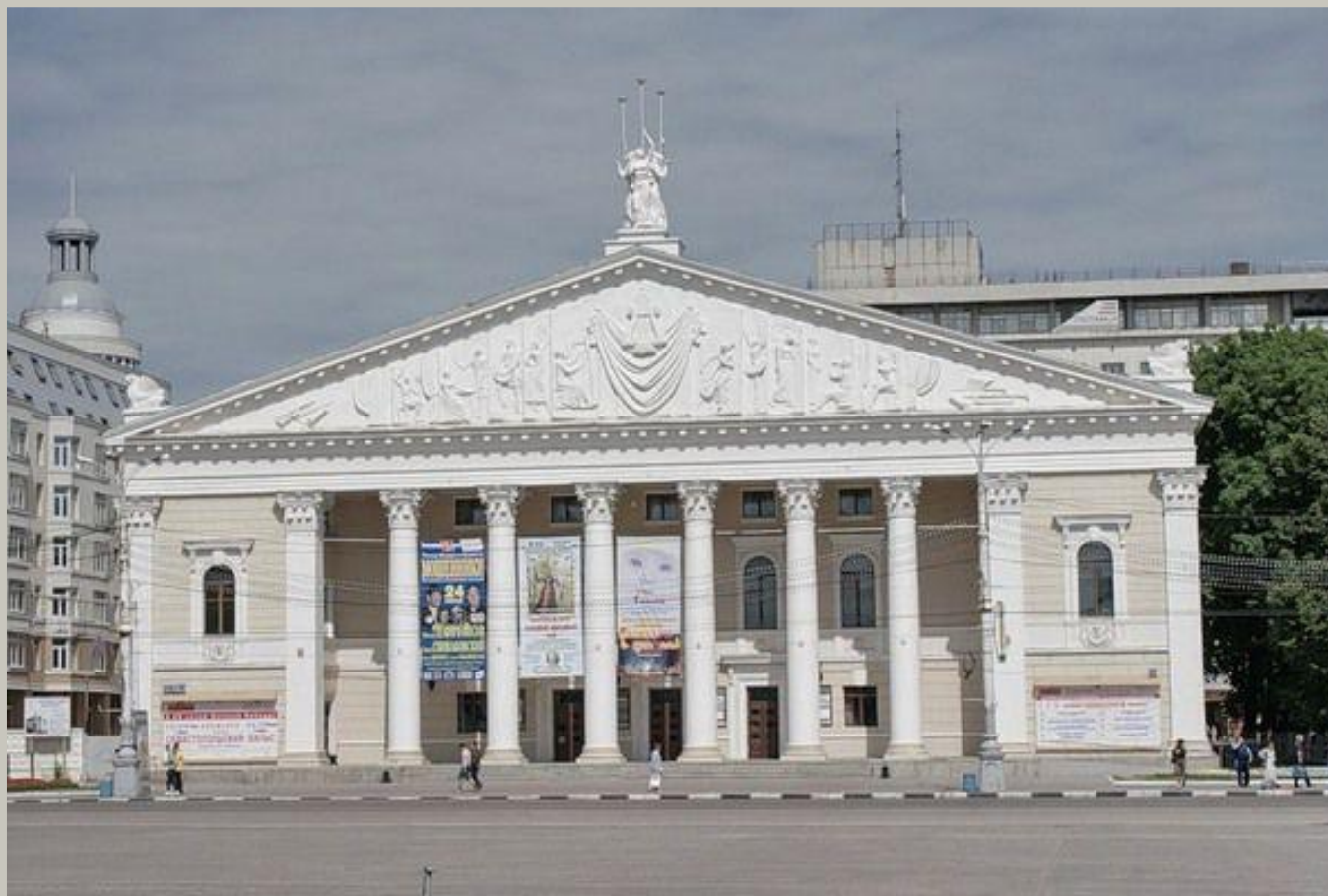
ТЕАТР ОПЕРЫ И БАЛЕТА